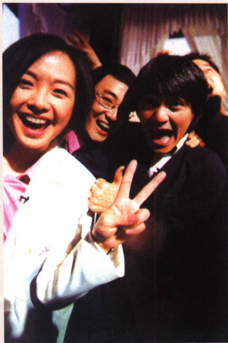
申奥成功的那一天，旁边是 窦文涛和周星驰。