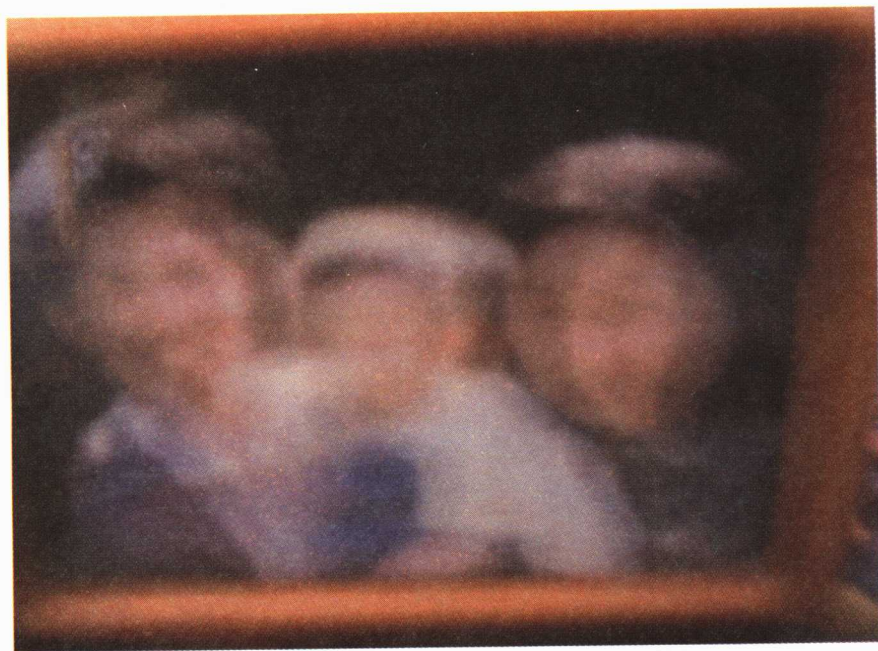
我的全家福。(陈森森的照片记录)