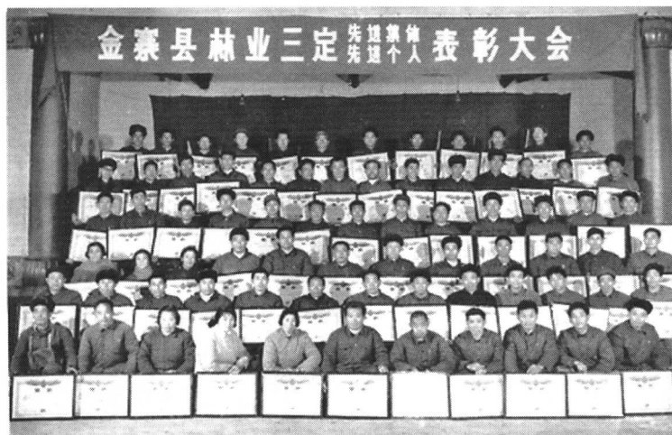
● 1981年金寨县林业“三定”受表彰的先进集体和个人合影