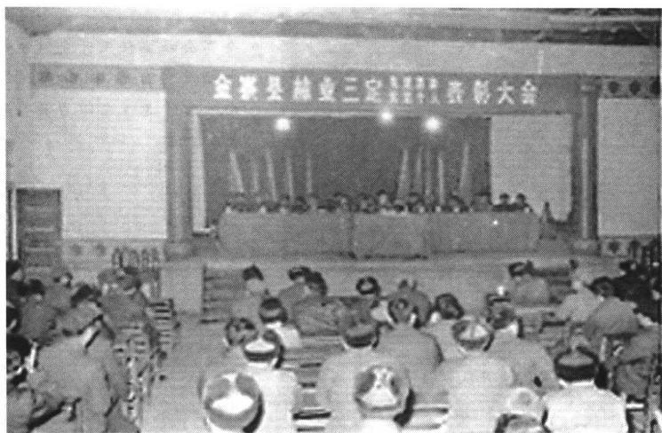
● 金寨县林业“三定”先进集体、先进个人表彰大会会场