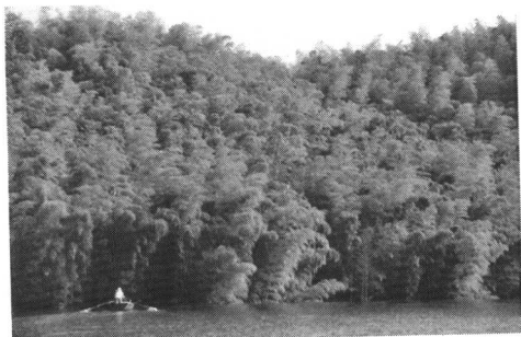
● 翠竹映碧水 (图为响洪甸库区生态保护林)