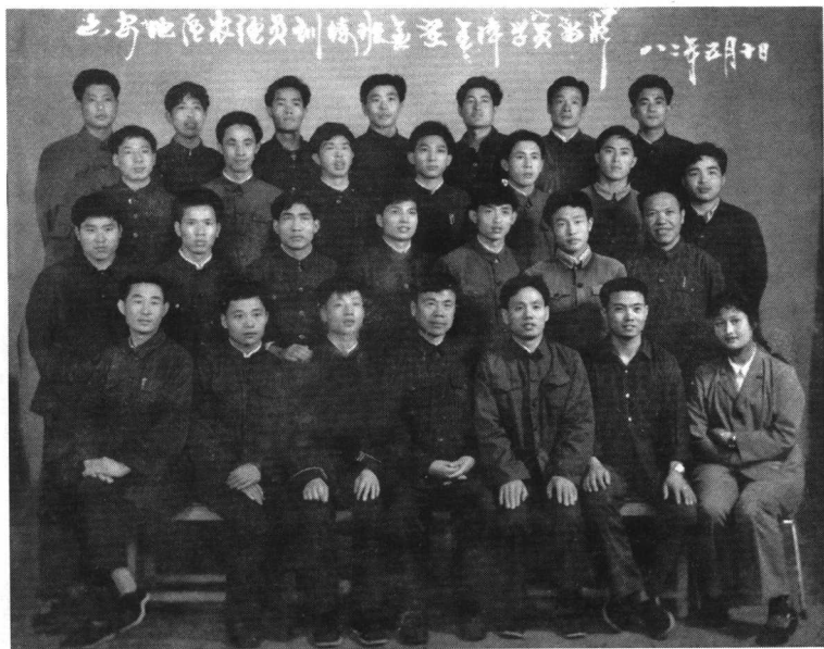
1981年国家首次从农村基层干部中招考农经管理干部， 金寨县农经员培训结业合影