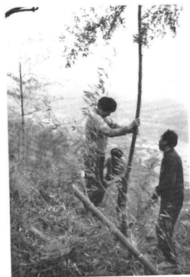
● 农民在到户的荒山上栽毛竹