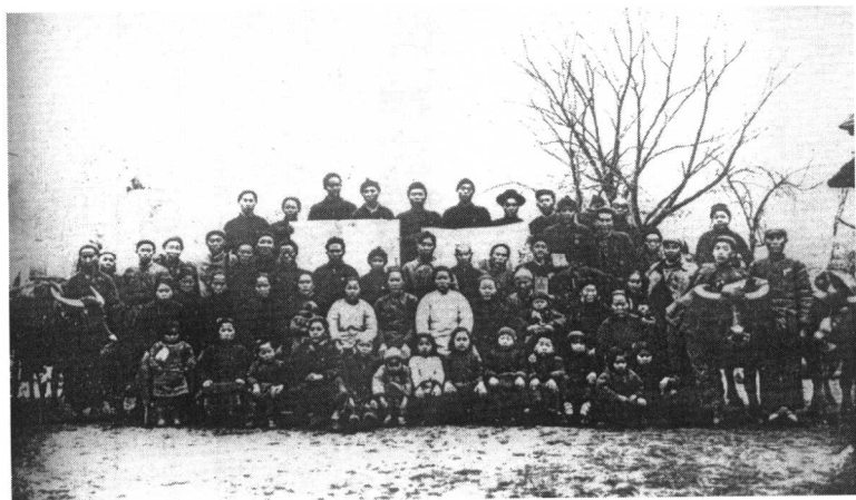
● 1953年3月李维禄农业初级社成立大会