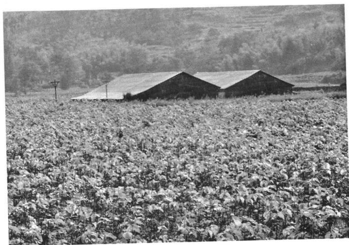
● 1995年全县桑园20万亩，年产茧7万吨。 (图为青山镇良桑品种育71-1示范园)