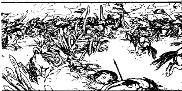
53 毛活来见敌人两路大军全被杀败，便指挥左右路军一齐向乃蛮中营杀去。乃蛮主帅曲薛吾见勃特军象山洪一样突然冲进中营，大吃一惊，连声叫苦。

感情的色彩和充满历史氛围的形象感突出故事性，绘画又以视觉艺术的历史纪实的特征，于较高层次的审美意味上，使形象和形式感较好地取得了有机的结合。