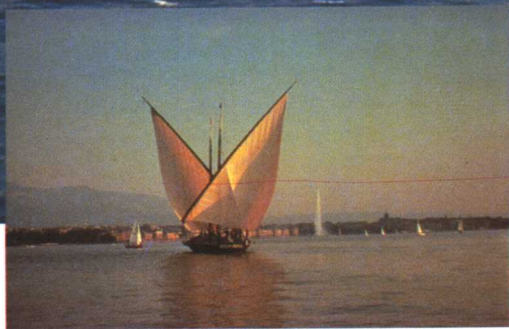
莱蒙湖上的帆船