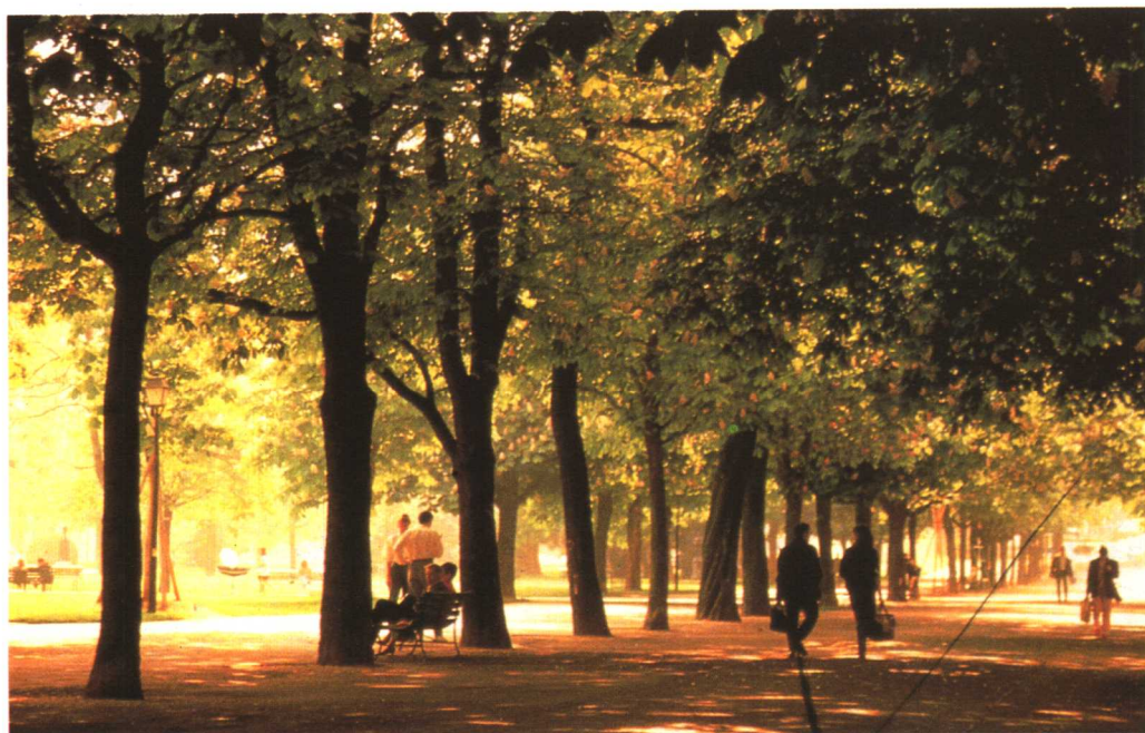
城堡公园