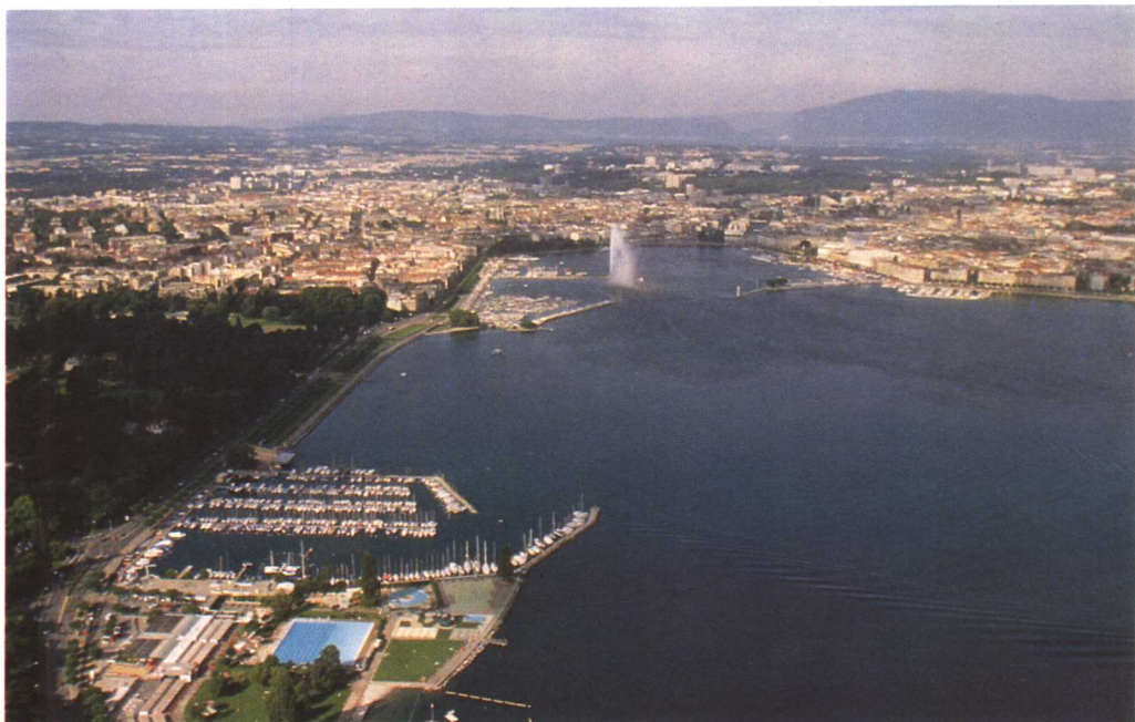
日内瓦鸟瞰