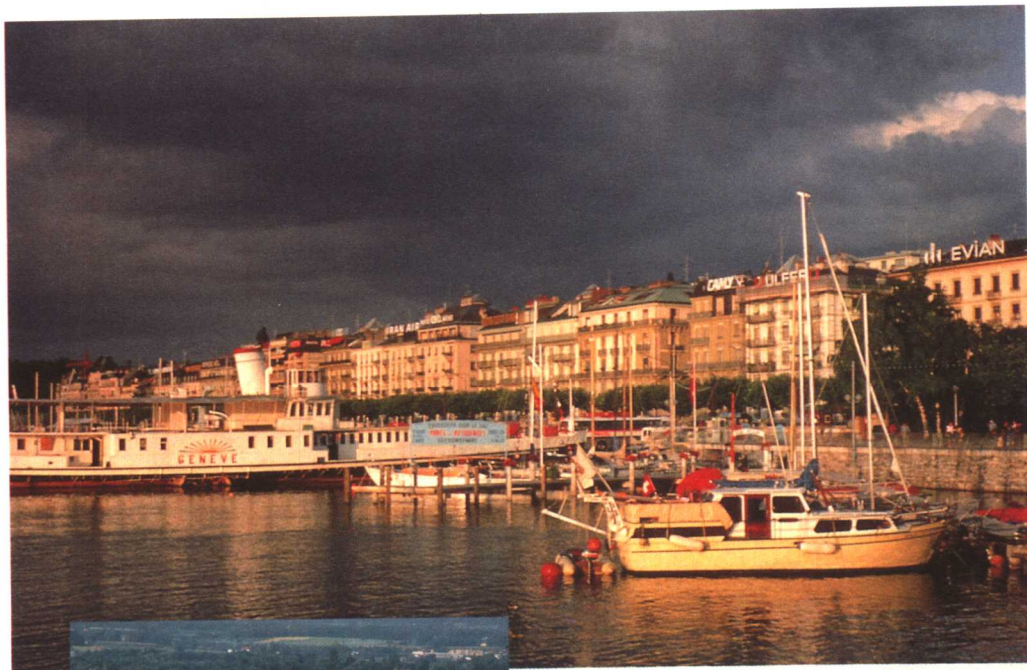
莱蒙湖左岸风光