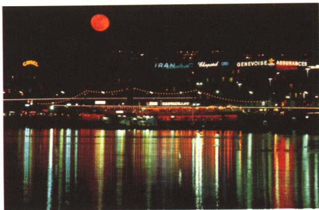
港湾夜景