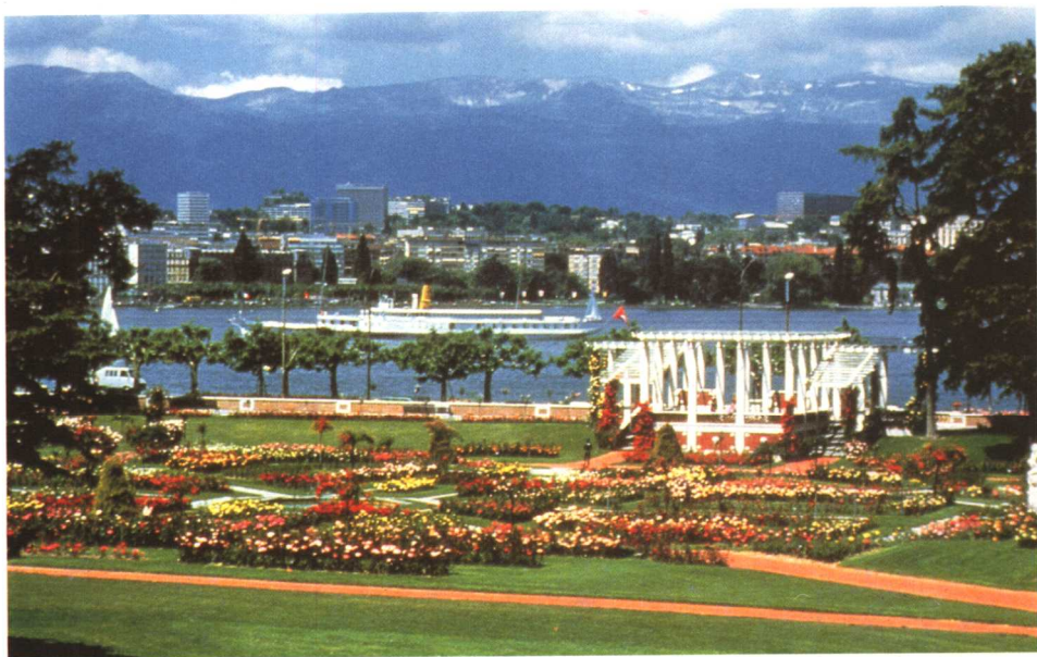
谷仓公园