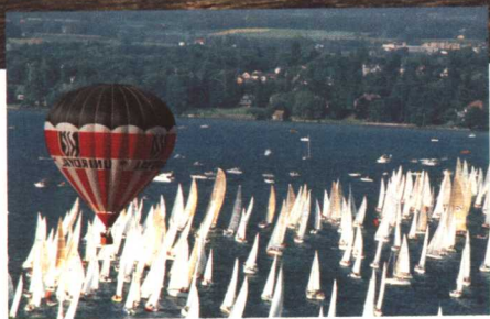
莱蒙湖上的帆板