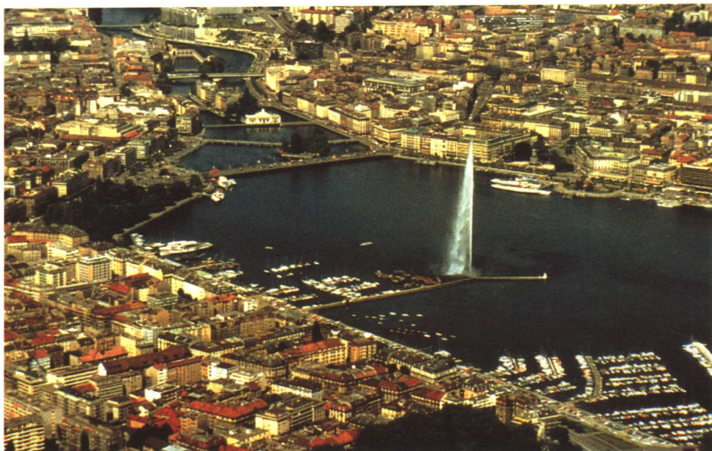
港湾鸟瞰