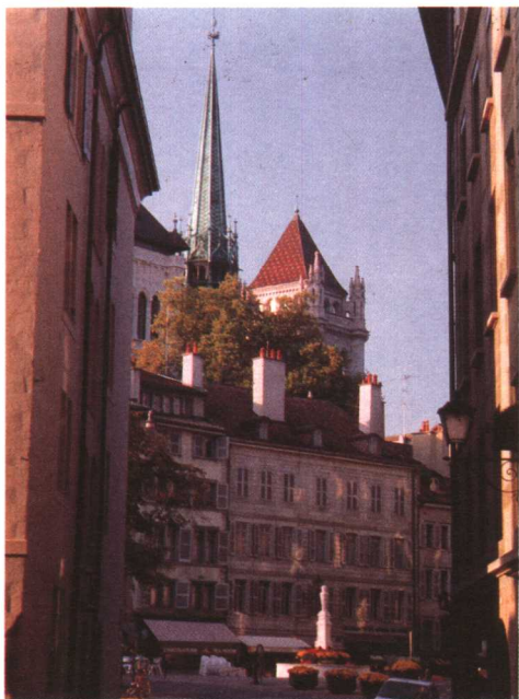
老城风貌