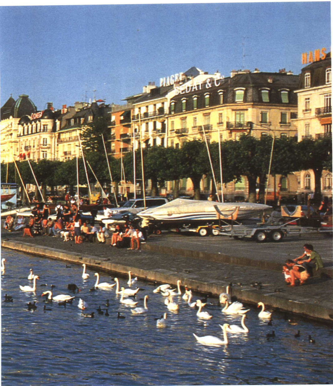
港湾左岸风光