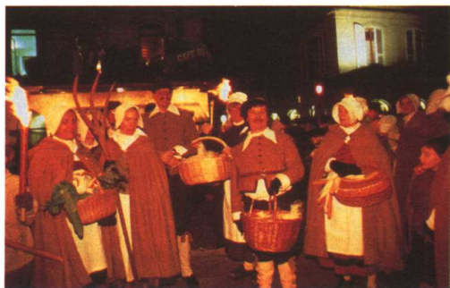
登城节化装游行