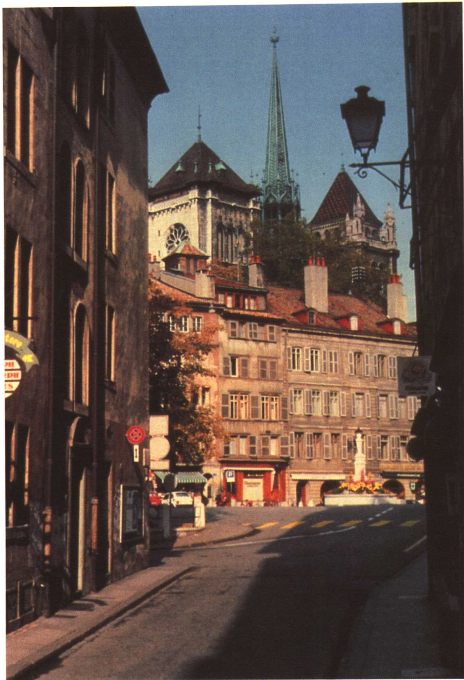
圣皮埃尔大教堂