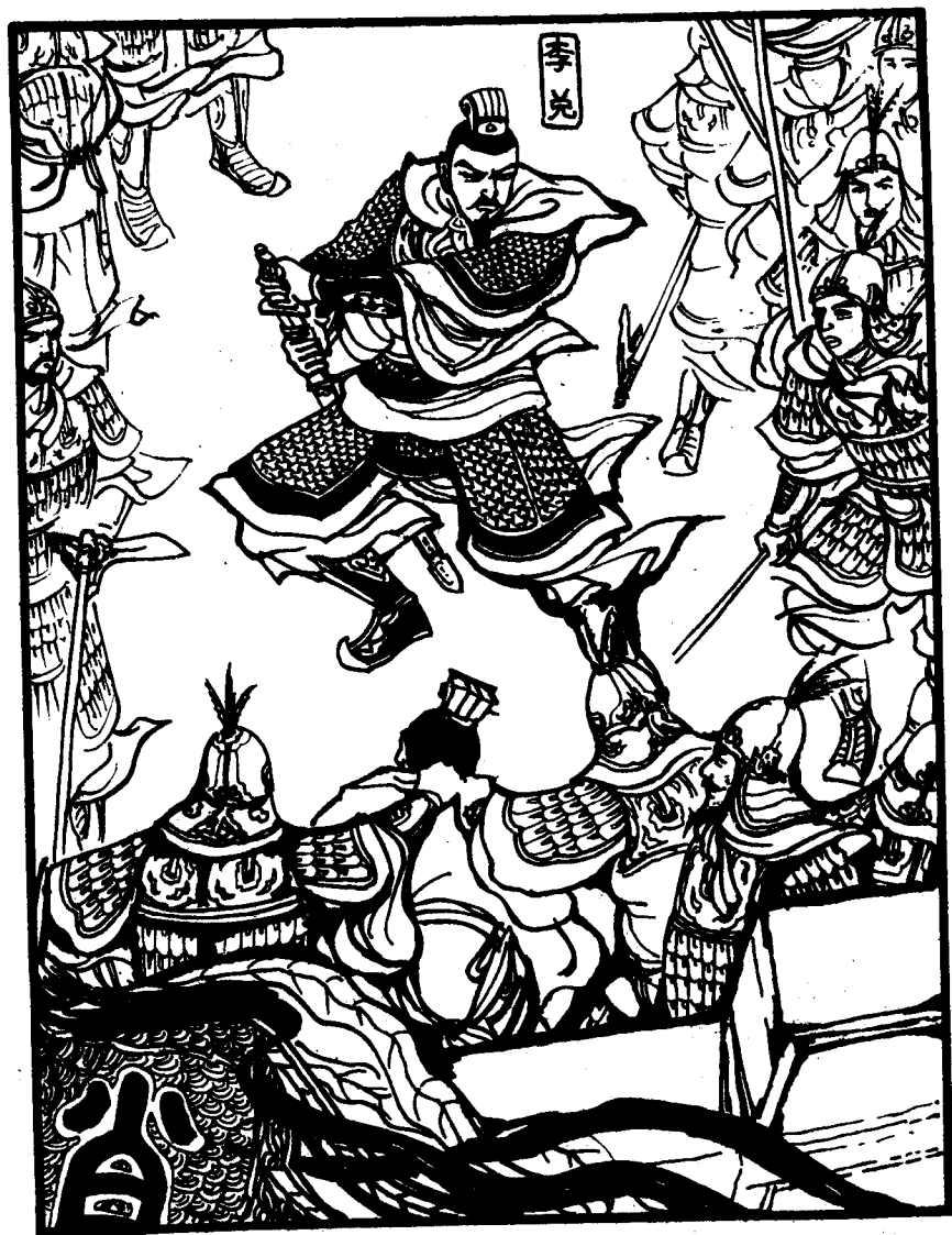
19. 主父流泪不语。众人在复壁之中搜出安阳君，李兑一剑斩断其头。