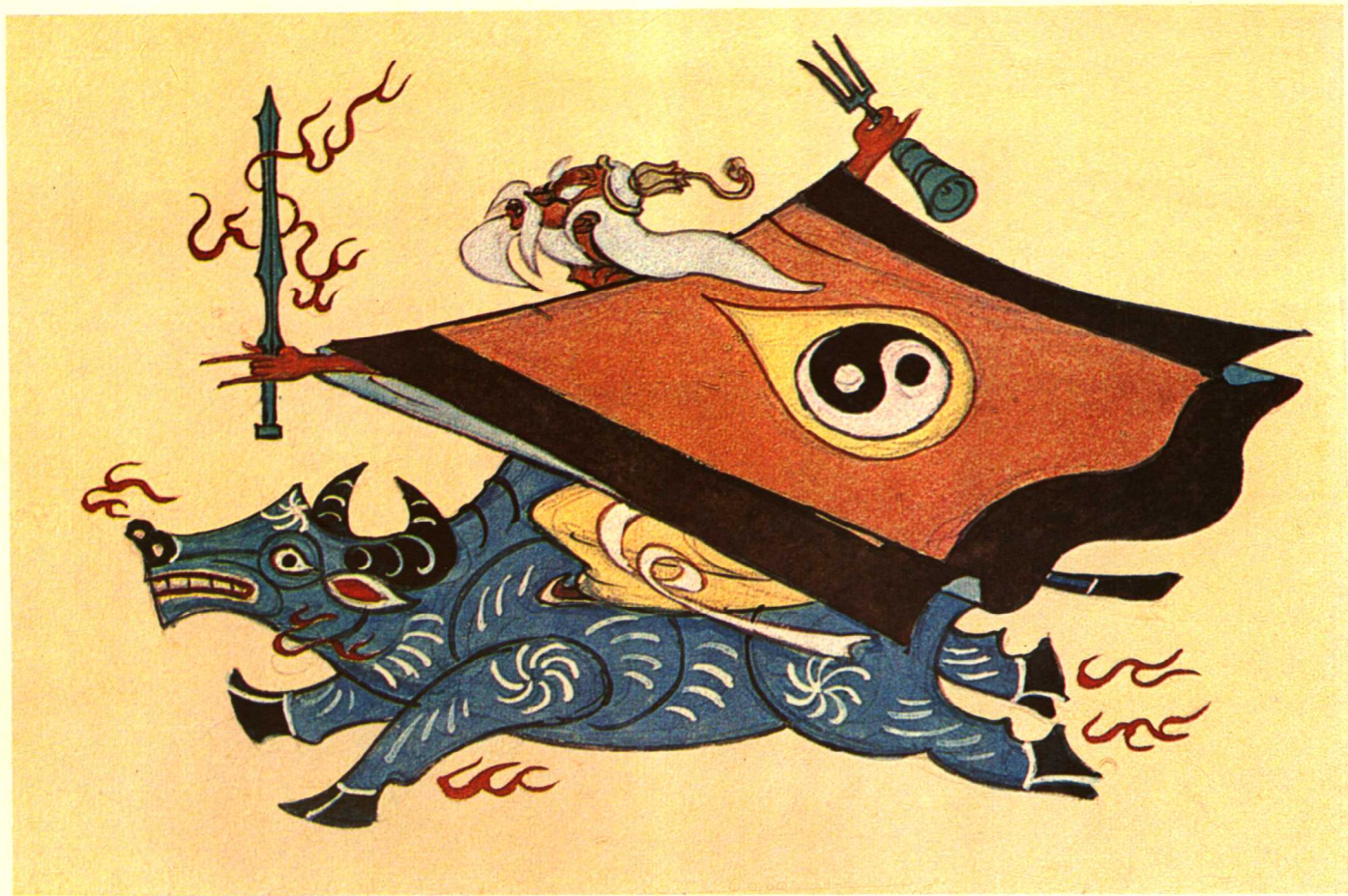
大闹天宫 (太上老君)