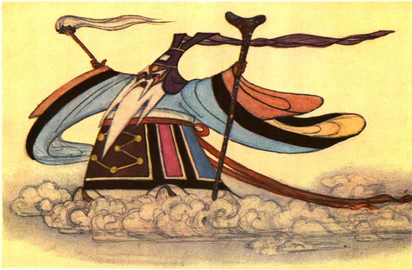
大闹天宫 (太白金星)