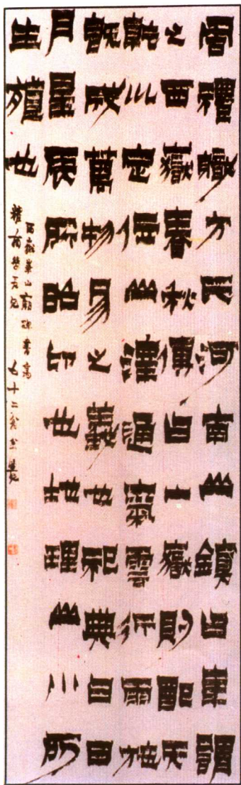
金衣 节临西岳华山庙碑