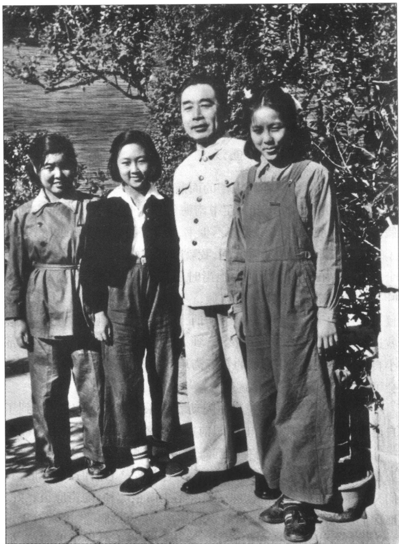
周恩来和周秉德(左二)