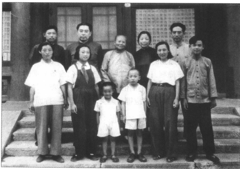
周恩来、邓颖超与周秉德全家

我向伯伯的卫士长成元功去领，先是 120 元，后来是 200 元。为什么伯伯给我们家这种固定的帮助呢？这要从我爸爸说起。”