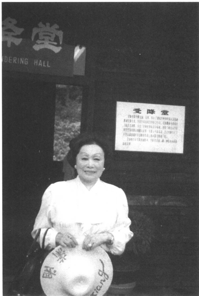
陈纳德夫人陈香梅在受降堂

我军在华所遭受的最可怕的打击百分之六七十来自陈纳德将军领导的十四航空队。如果没有遭遇他们，我们便能随心所欲地推进到中国的任何地方。