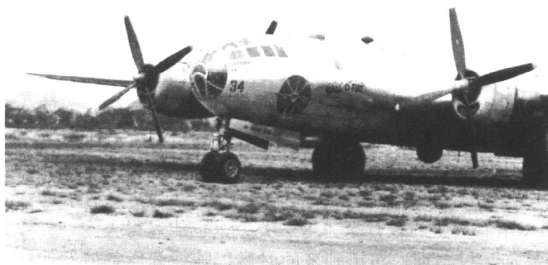
美国在二战中使用的各式飞机

他的悲天悯人、疾恶如仇、同情弱者的骑士风度，又来自于幼年丧母的不幸和最敬爱的继母心血的浇灌。