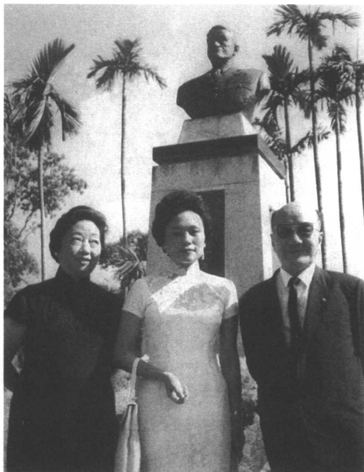
在台北美新公园的陈纳德将军铜像前