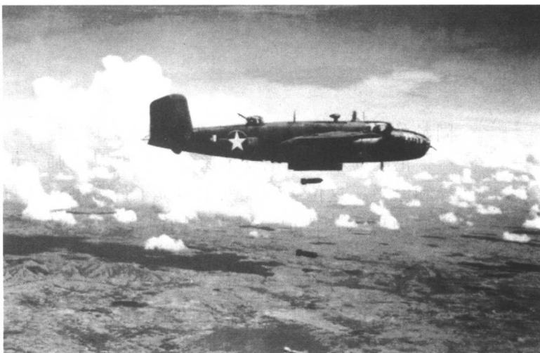
第二次世界大战中美国使用的各式飞机