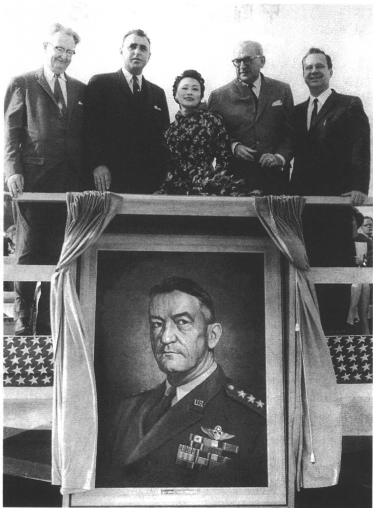
飞虎将军的画像现仍挂在美国国防部五角大楼大厅中