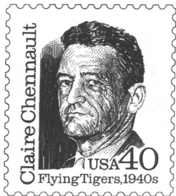
1990年出版的陈纳德将军邮票，属首次发行