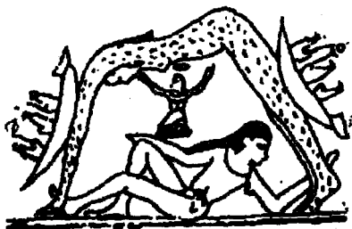
图1 古埃及太阳神的传说

天早晨从东山门出来,照亮人间,晚上从西山门归去,进入天庭,让月亮接替它工作。在古希腊的神话里,太阳神“阿波罗”有许多本领和美德,其中之一是它左手托着一个精美绝