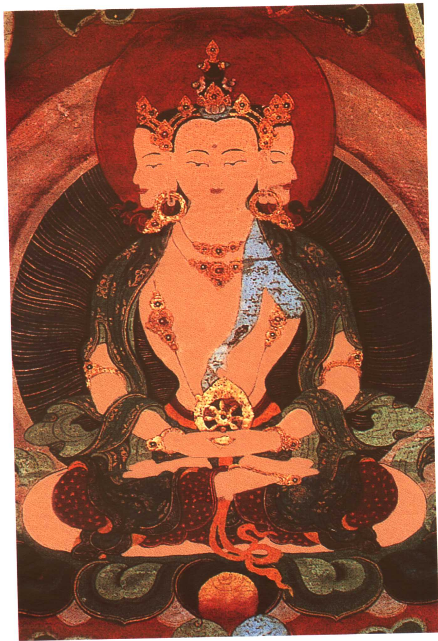
胎藏界三面大日如来