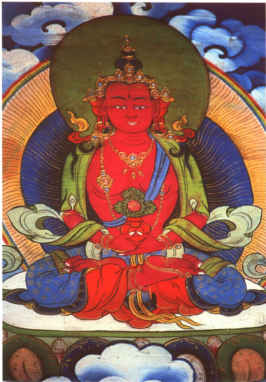
双手托药钵的药师佛