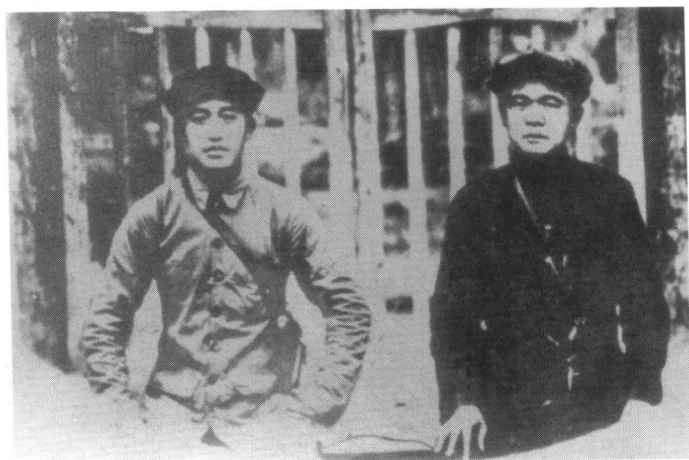
1935年8月初,吴焕先(左)、徐海东于甘肃两当县城合影