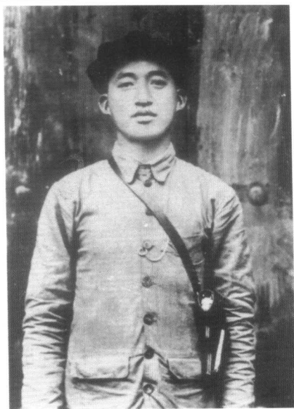
长征中任红二十五军政治委员的吴焕先。他在泾川县四坡村战斗中壮烈牺牲，时年28岁。这是他惟一的一幅半身戎装遗像