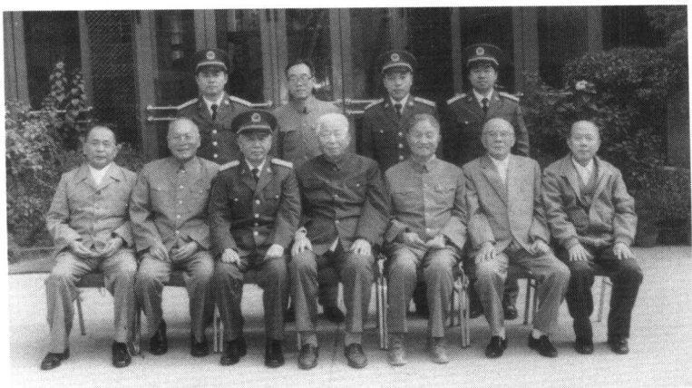
1988年10月,《红二十五军战史》编审委员会领导成员与工作人员合影。前排左起:王诚汉、陈先瑞、刘华清、郭述申、程子华、刘震、张池明;后排左起:陶景春、卢振国、姜为民、王增义