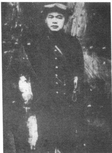
长征中的徐海东将军