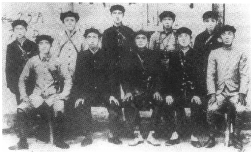
1935年8月初,红二十五军部分领导同志与警卫人员在两当县城合影。 前排左起:吴焕先、郭述申、徐海东、戴季英、赵凌波;后排中为警卫员詹大南