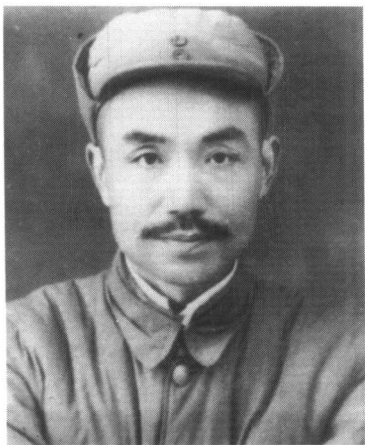
红军时期的中共鄂豫陕特委书记郑位三