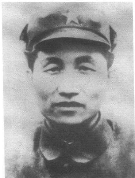
长征中历任红二十五军 军长、军政治委员的程子华