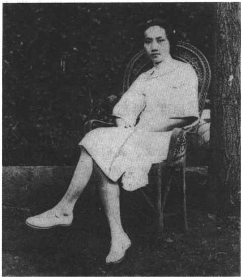
20年代执教的女性屈指可数，这位神态自若的女教师所穿的短款旗袍在当时十分超前。