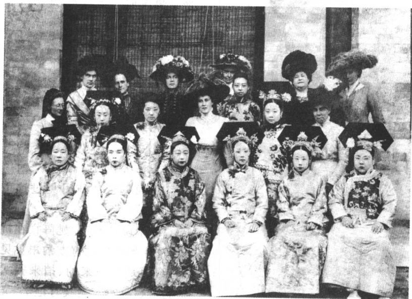
端坐前排的是几位清末宫廷命妇，站立后排的是各国大使夫人。