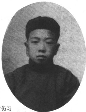
许多男孩子在辛亥革命后仍习惯穿长袍戴瓜皮帽。

这素馨弟弟在男生里是个受气包,捆脑袋扯耳朵捏鼻头之类的事几乎每日都发生在他身上。男生群