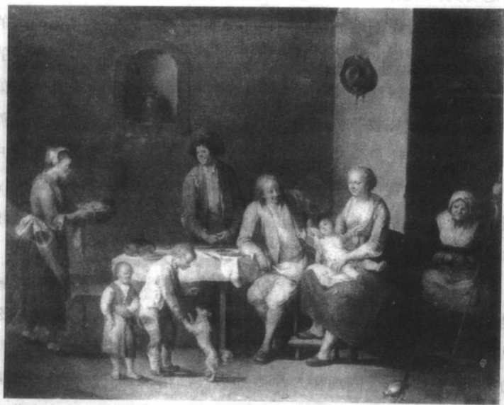
图1 18世纪的农民家庭，油画，J. A. 赫尔兰茵作。