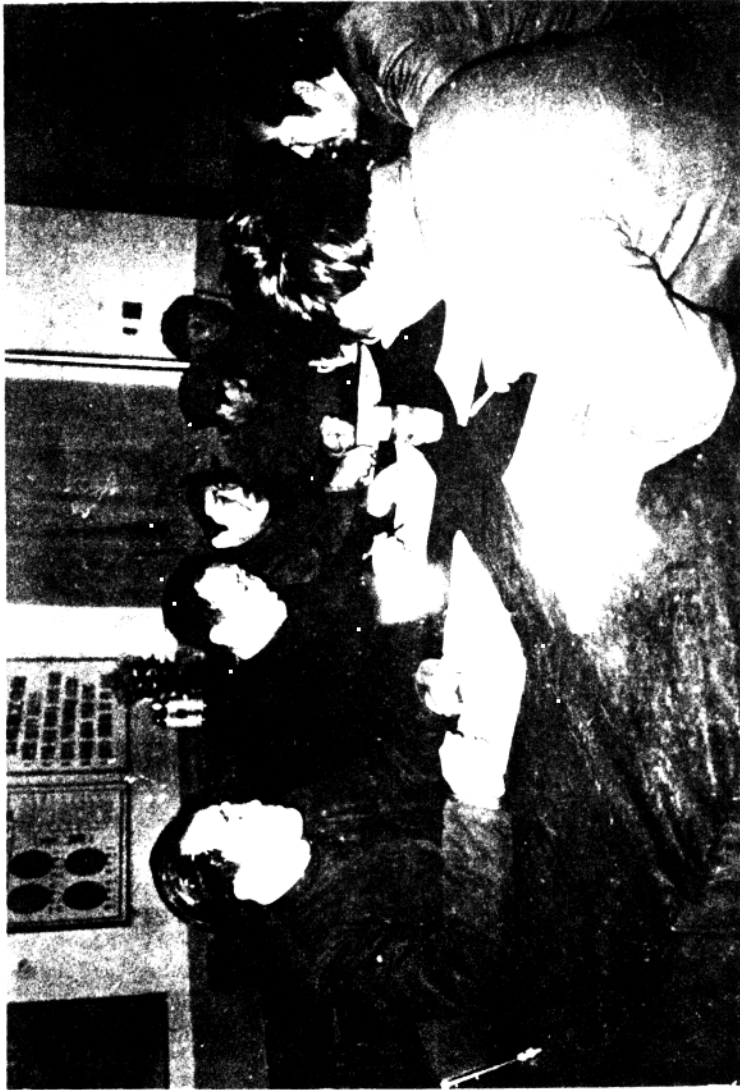
1950年10月，北京，中南海，毛泽东主席在接见苏联客人。