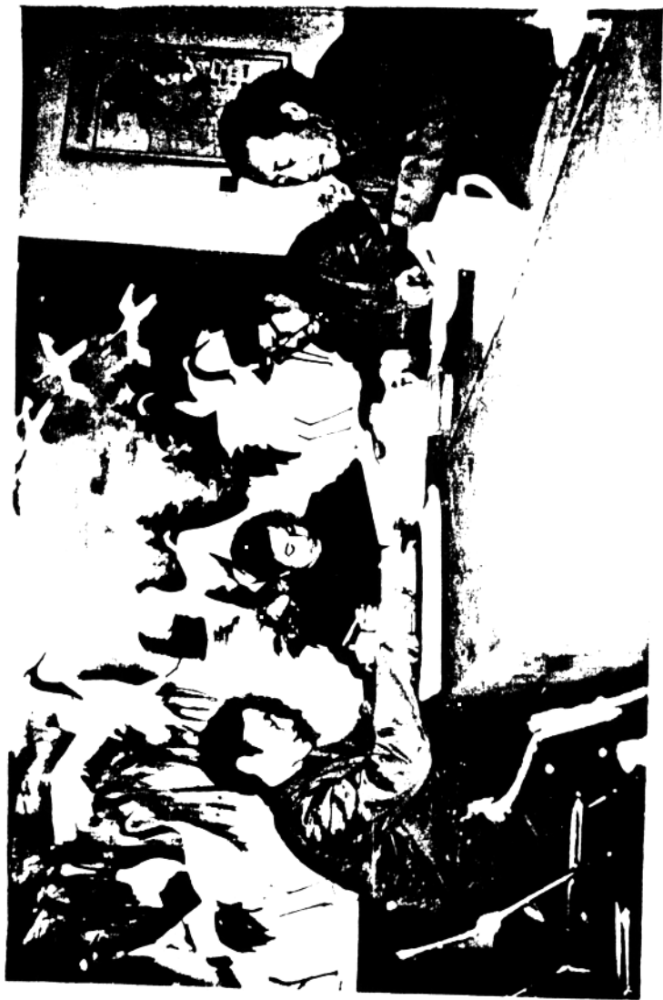
編輯小組成員正在修改《木木志》初稿