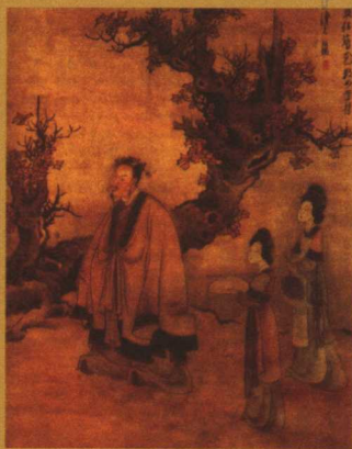
河东夫人（柳如是）像。明吴焯画。美国哈佛大学福格艺术馆藏

杨升庵簪花图。明末杰出的画家陈洪绘。杨慎（1498—1559）别号升庵。他被流放云南后，虽夫唱妇随，但终因政治上失意，心情落寞，常作伴狂状。此画描绘的杨慎头作双髻，插花其上，不伦不类，即其一例。