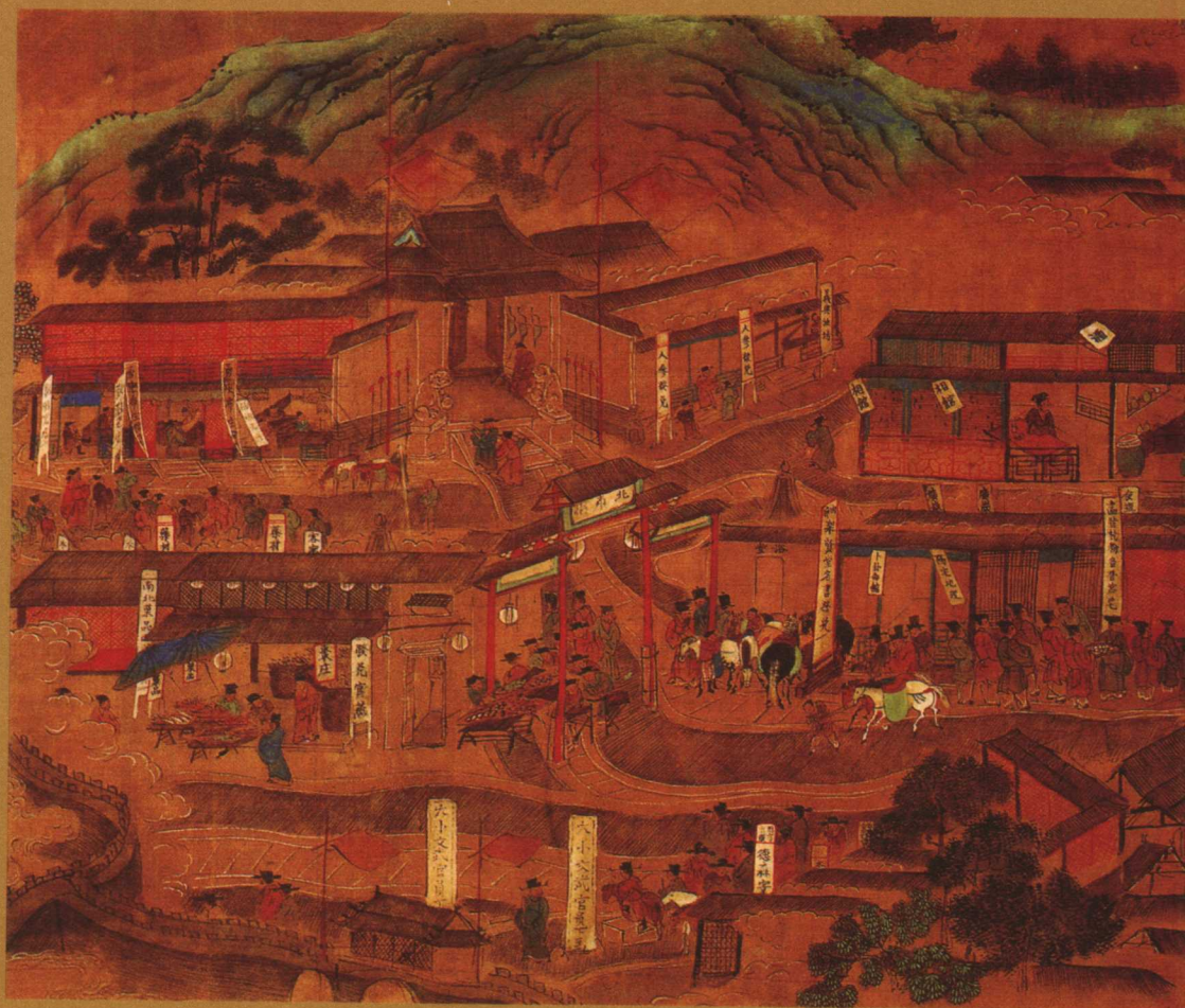
明南都繁会图卷局部。传为明中叶大画家仇英(?)·1552)所绘。此画生动地展现了明中叶南京繁华的商业景象，是“三百六十行”的缩影。现藏中国国家博物馆。