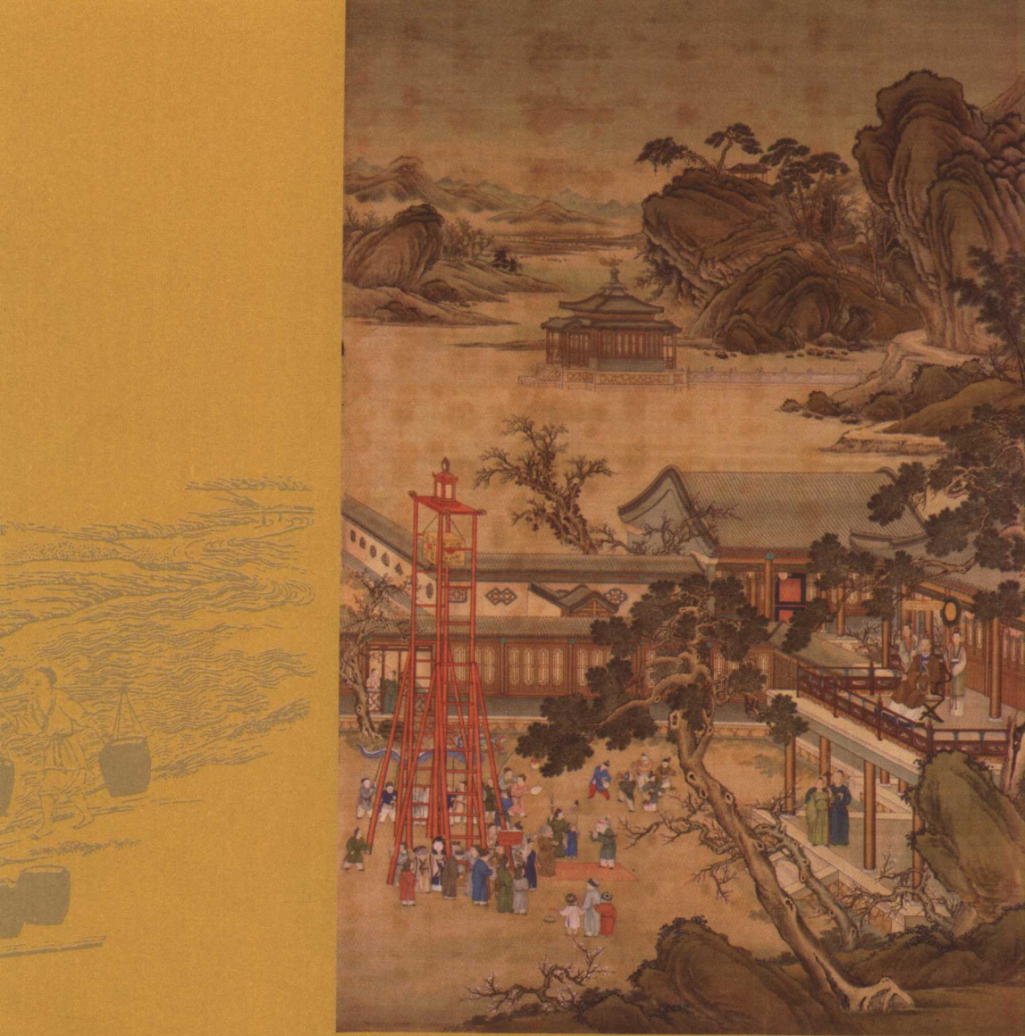
清人画弘历元宵行乐图轴