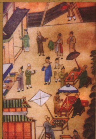
明人绘皇都积胜图局部。从中可看出当时北京市井的繁荣。中国国家博物馆藏。