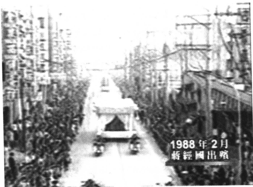
蒋经国出殡时的场景

1988年1月13日，“行政院长”俞国华宣布蒋经国逝世的消息：“我们敬爱的国家的元首，以及本党的主席已经于今天下午，三点五十二分辞世，使我们国家损失了一个敬爱的领袖。”