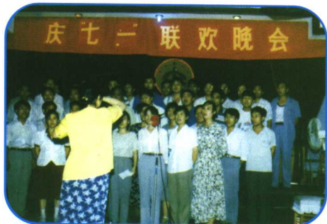
2000年，市局机关举办庆“七·一”晚会