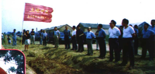
省、地、市领导 在永济土地开发现场