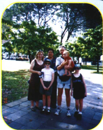
多交流 和英国同行 一家在广州