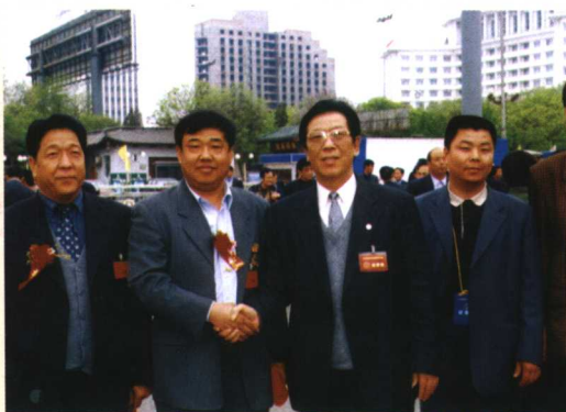
2001年5月省劳模会 时，常务副省长薛军会 见部分代表