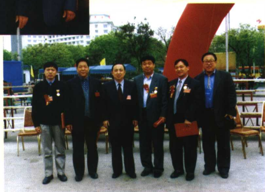
2001年5月省劳模会 时，副省长杨志明会见 部分代表