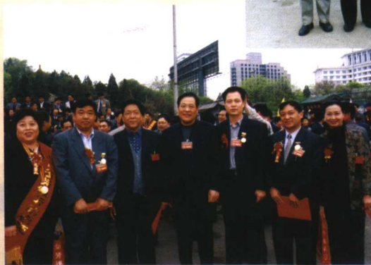
省人大副主任、省工 会主席姚新章亲切会见 运城部分代表