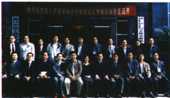
2000年作者在海南 参加全国依法行政座谈 会并发言