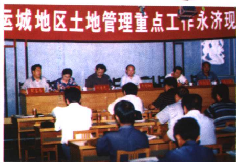
全区土地管理永济现场会