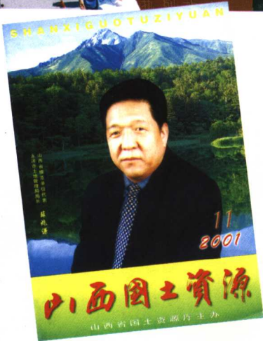
永济土地局被省委、省政府授予“省模范单位”后，省国土资源厅决定重点宣传永济