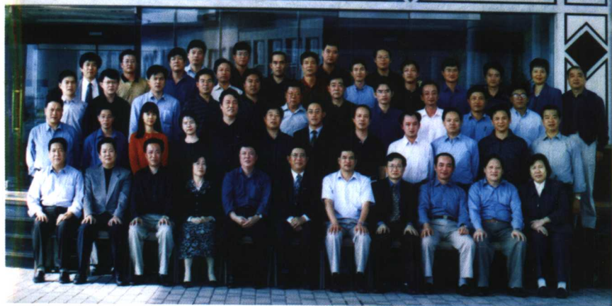
国土资源部李元副部长在宁波主持召开座谈会，作者参加并大会发言