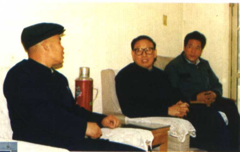
1990年，国家土地管理局王先进局长听取永济土地管理工作汇报