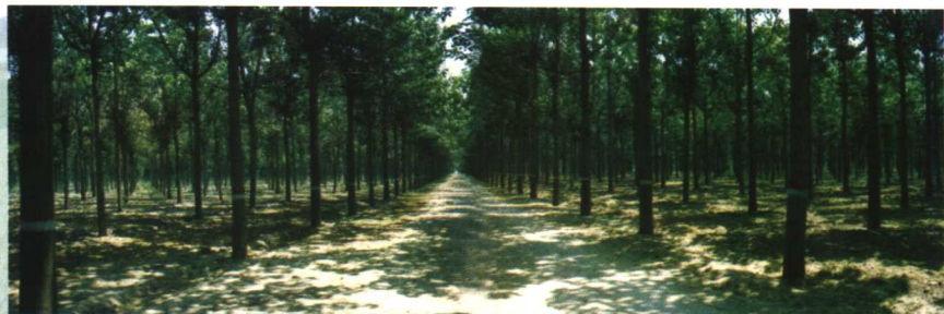
摄影作品：万亩泡桐 苍绿挺拔