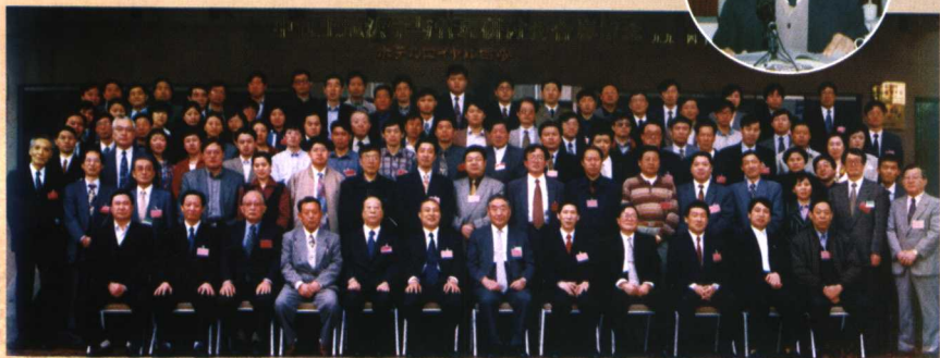
1999年作者在西安参加中日土地法学与管理研讨会