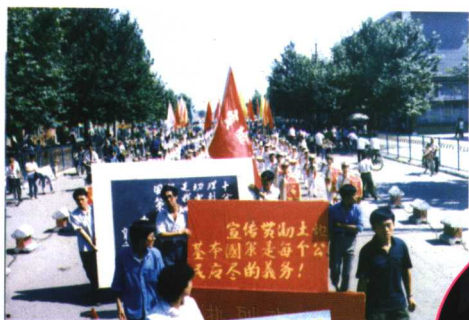
永济市五大班子参加“全国土地日”游行大宣传