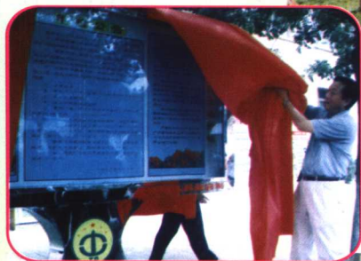
市委书记潘和平为全 区第一块土地公告揭牌