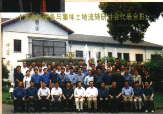
2001年，作者在杭州 参加全国土地储备会议并 发言