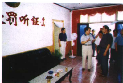
运城土地局领导参加听证会