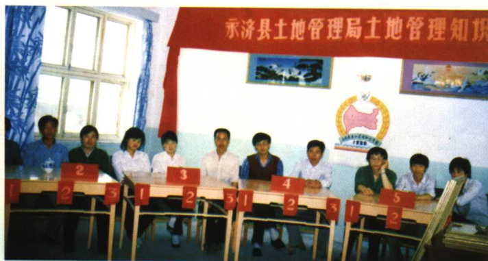
1994年6月，永济社会各界参与土地管理知识竞赛