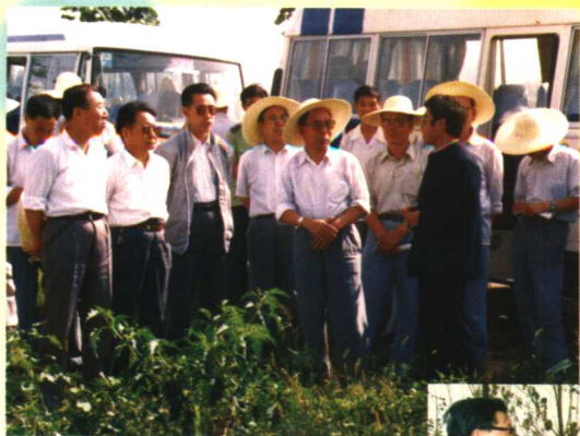
1989年国务委员陈俊生同志视察永济土地开发工作