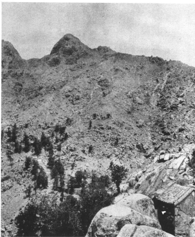
“快活谷”或“快活三里”