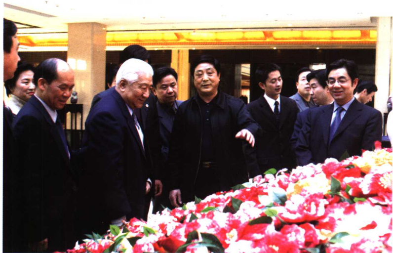
全国政协副主席丁光训（左二）来宜兴视察