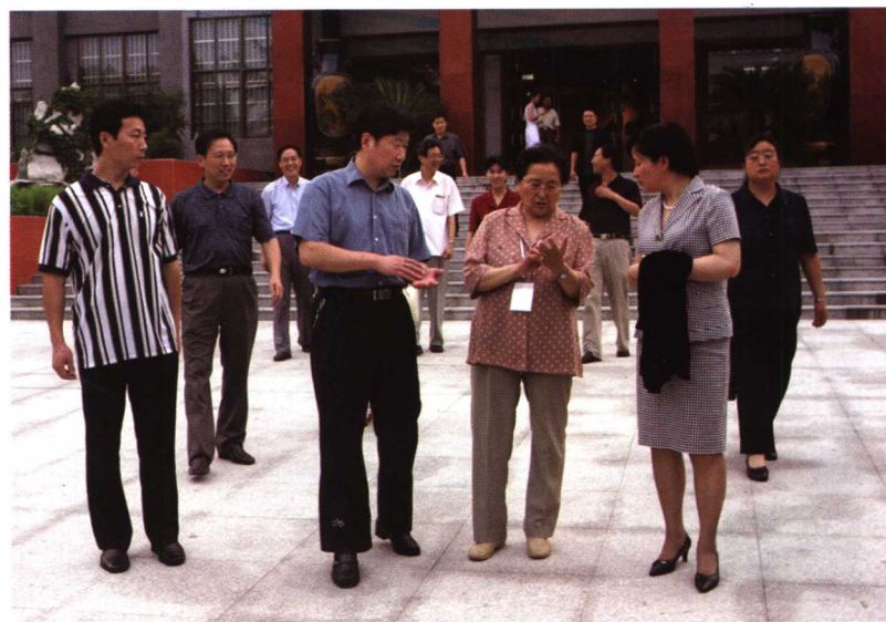
全国人大副委员长何鲁丽（前左三）在宜兴视察