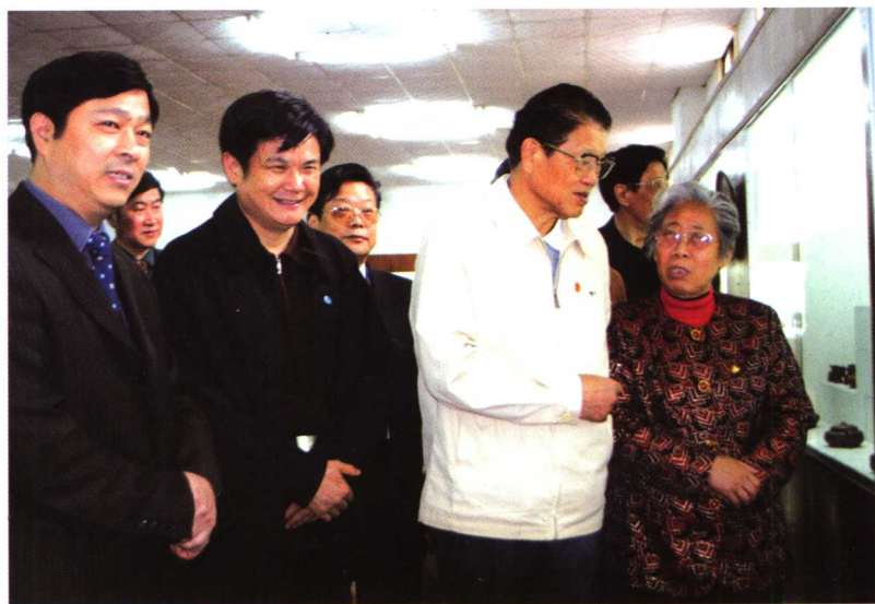
全国人大副委员长李铁映（左三）在宜兴视察