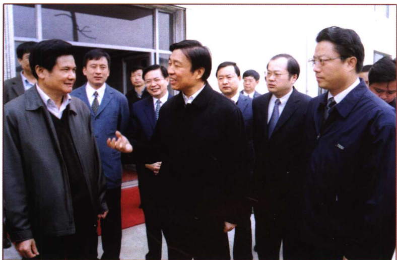
省委书记李源潮（中）、无锡市委书记杨卫泽（右）视察宜兴城市建设