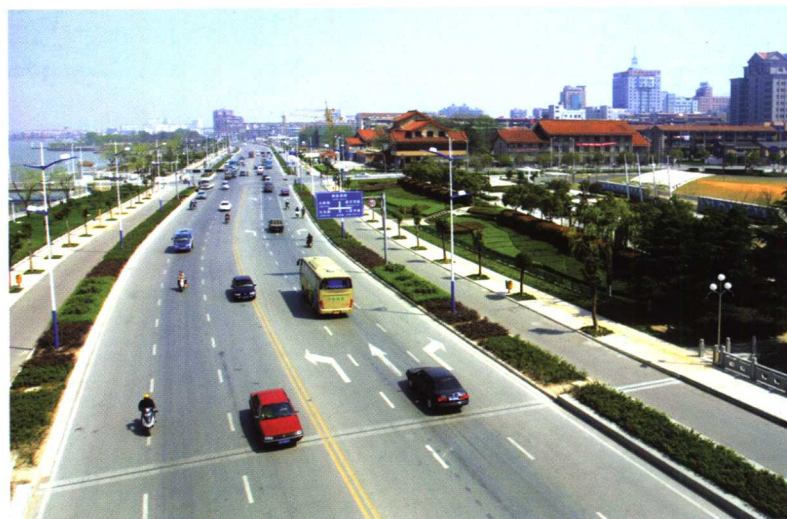
宽广美丽的沱滨大道