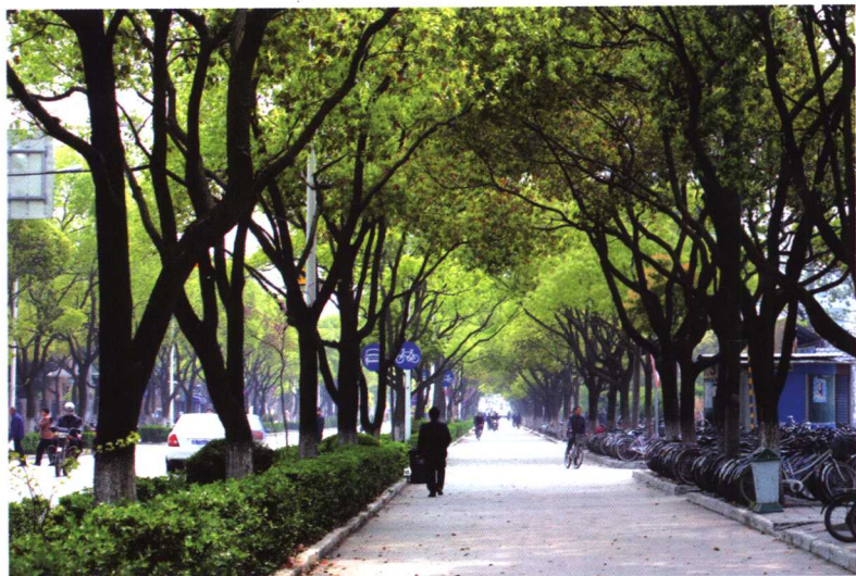
绿树成荫的城区道路