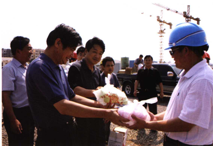
市领导慰问重点工程建设者