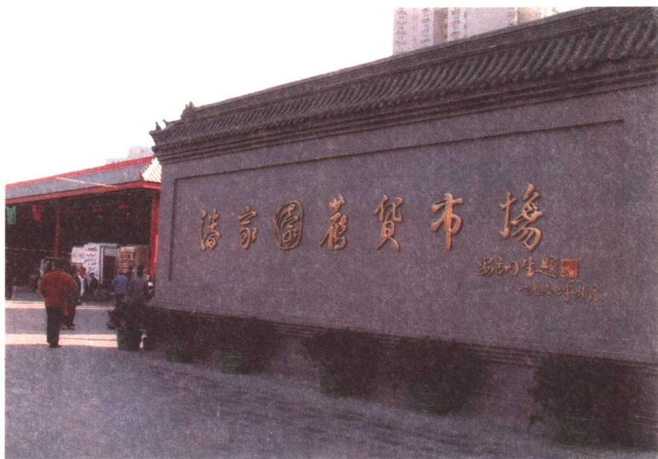
潘家园旧货市场入口

场所。从此后潘家园旧货市场规模越做越大，设施越来越完备，名声也越来越响亮，终于成为亚洲第一，世界闻名的大型旧货市场。