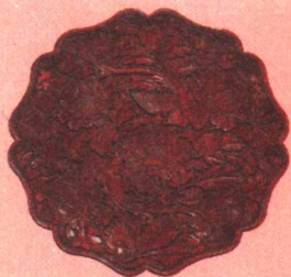
剔红花卉双鸟纹花瓣口盘