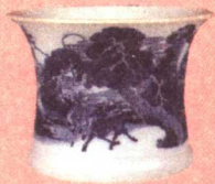
清康熙 青花松鹤延年图笔筒

今天的北京是中国乃至亚洲最大的古玩集散地，各类古玩城、旧货市场无论从经营种类还是场所规模均居全国之首。