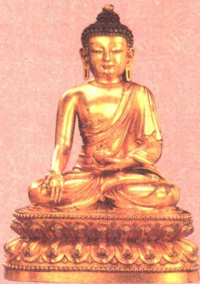
明永乐 鎏金铜药师菩萨坐像