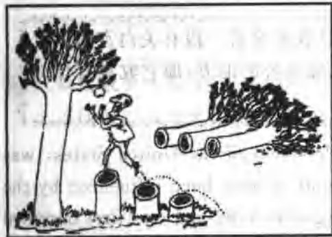
★终于能够着果子了