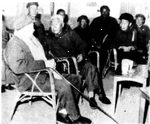
纪念“黄麻起义”50周年时与陈再道同志在一起。