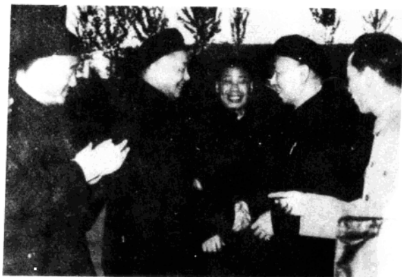
1964年刘少奇同志在郑州接见刘名榜同志、