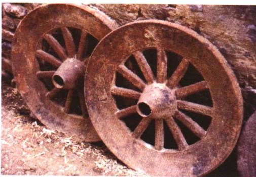
老车轮。20世纪80年代以前河南农村生产普遍使用的牛拉铁轮车车轮，斑斑锈迹折射出时代变迁的印记。 2000年摄于遂平县