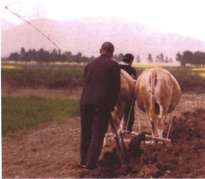
牛拉犁。几千年来传统的耕作方式，至今仍在普遍使用。 1999年摄于遂平县