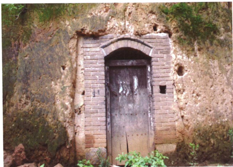
豫西窑洞。豫西邙山丘陵地区，农民已从祖祖辈辈居住的窑洞陆续迁出。 2001年摄于荥阳市