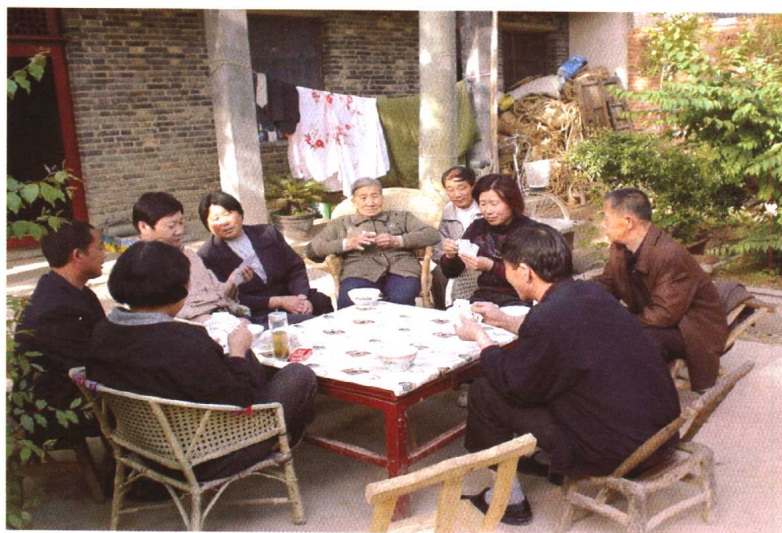
打扑克牌。农闲时节，一家人也坐在一起玩扑克牌。 2000年摄于泌阳县