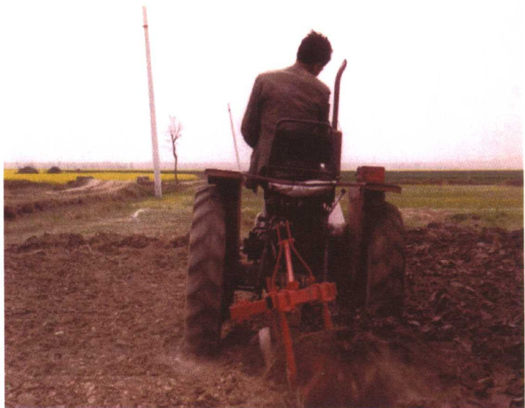
拖拉机犁地。20世纪80年代以后，动力机械耕作方式很受农民欢迎。