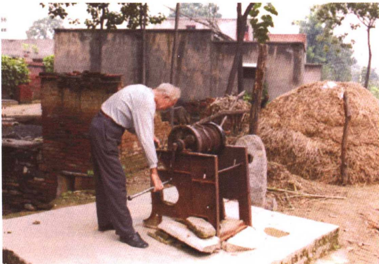
提水。豫西山区，一老汉在打水。 2000年摄于荥阳市