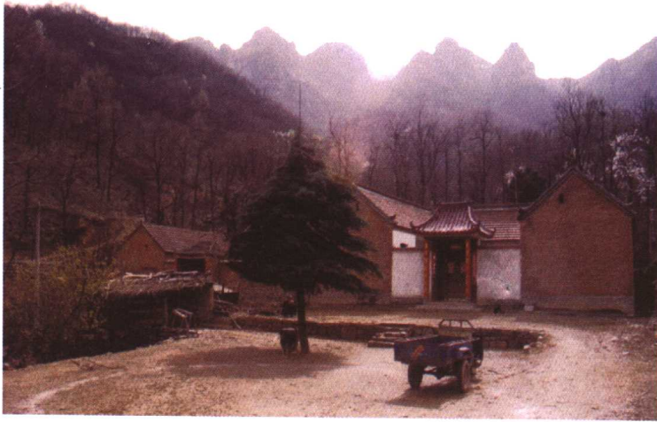
豫南民宅。随着农村经济的发展，农民的住房条件得到很大的改善。 1999年摄于泌阳县