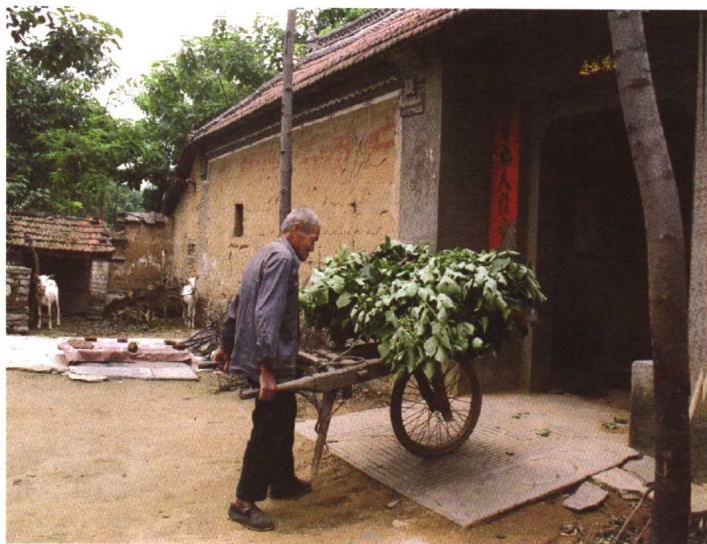
手推车。简易的独轮手推车，依然是山区农村比较普遍的工具。 2000年摄于荥阳市