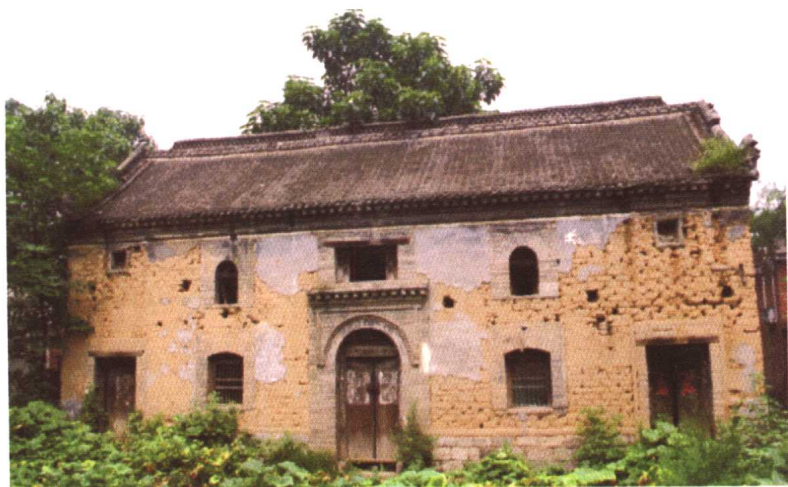
豫西老房。这种房屋的样式叫作“明三暗五”，开三个门。二层的阁棚可作为储藏室。 2000年摄于荥阳市