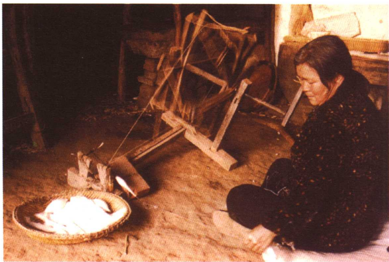
纺棉。这是20世纪80年代以前纺棉花的纺车，现在农村少数家庭还在使用。