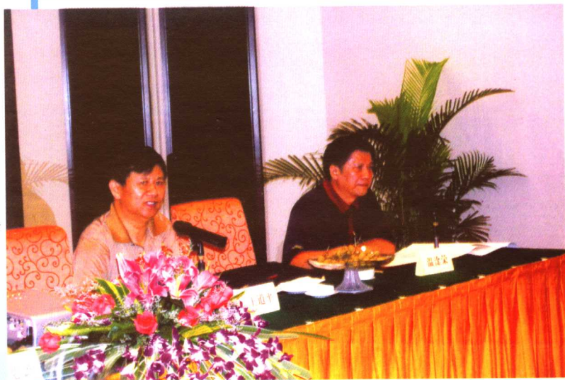
东莞市人民政府秘书长王道平同志（图左一），在“东莞市经济社会发展宏观战略研究专家评审会”上讲话，中共东莞市委政策研究室主任温淦荣同志（图左二）主持会议。