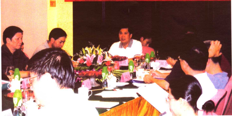
中共东莞市委常委、市委秘书长何嘉琪同志（后排左一），在“东莞市经济社会发展宏观战略研究专家评审会”上致辞。