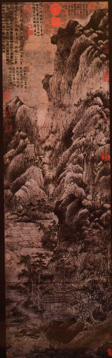
谷口春耕图 (左) 春山读书图 (右)