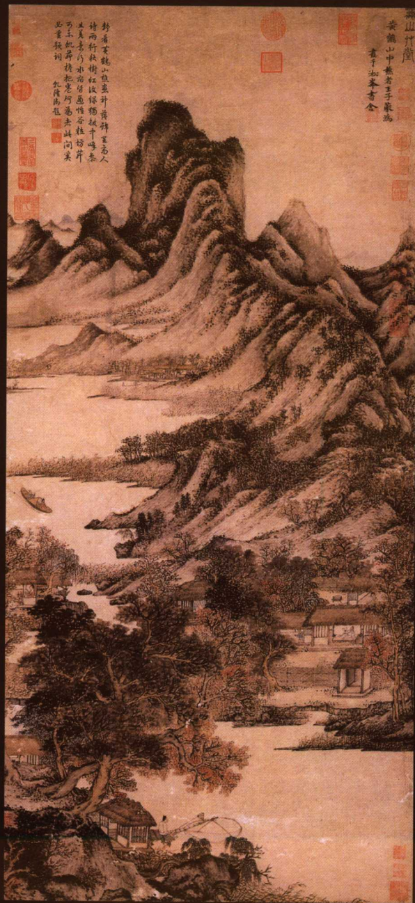
秋山草堂图（左） 葛稚川移居图（右）