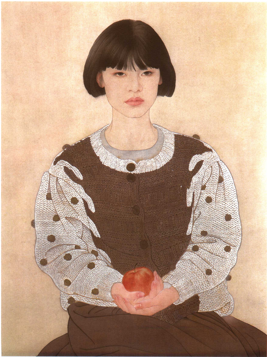
何家英 (He Jiaying)