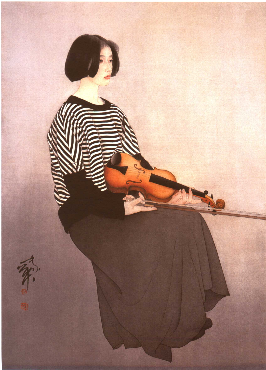
何家英 (He Jiaying)