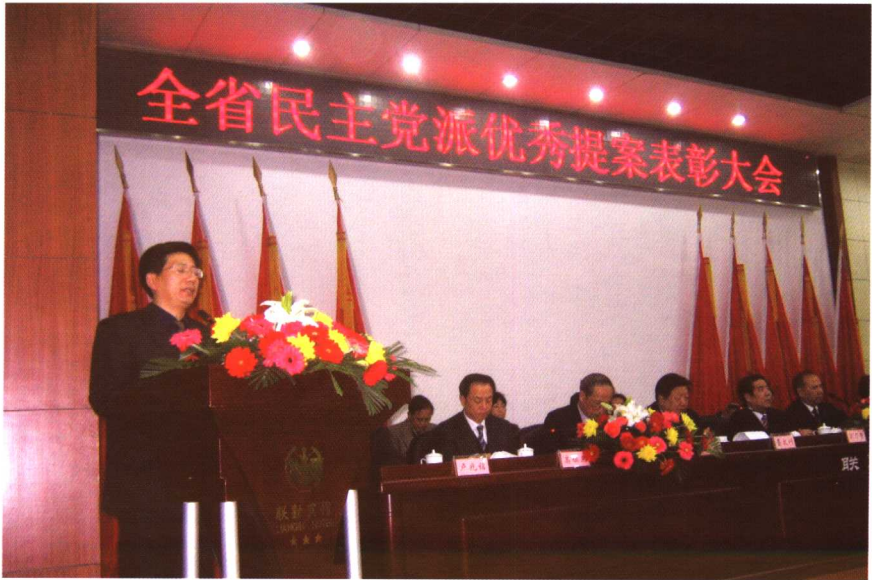
在全省民主党派优秀提案表彰会上介绍经验