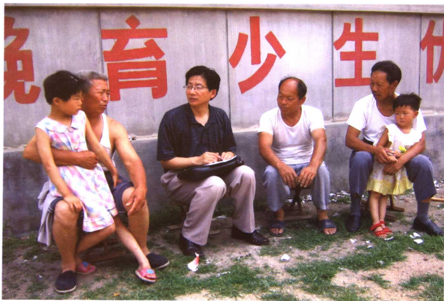
到农村调研农民负担情况