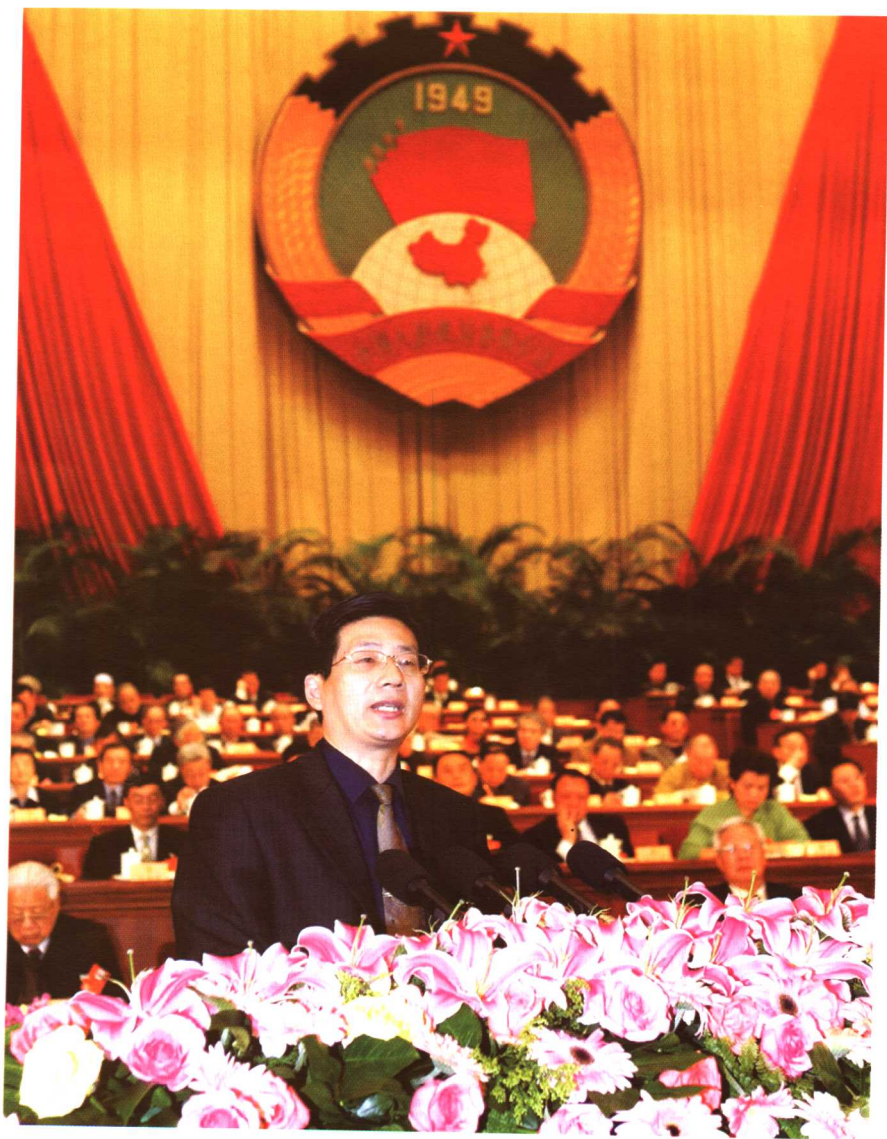
在全国政协十届三次会议上作大会发言