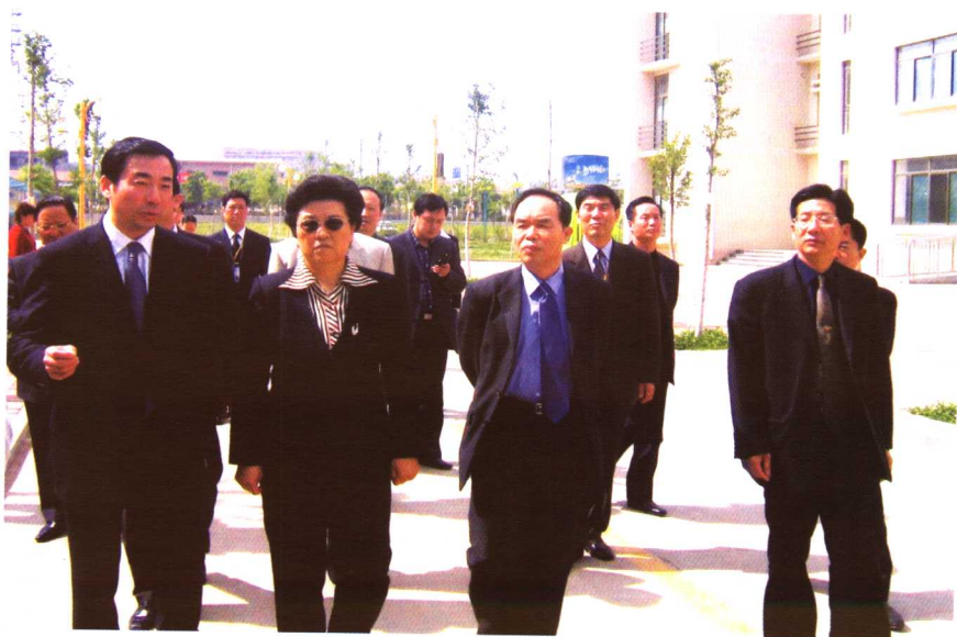
陪同国家部委领导视察全国教育收费示范县经验交流会现场