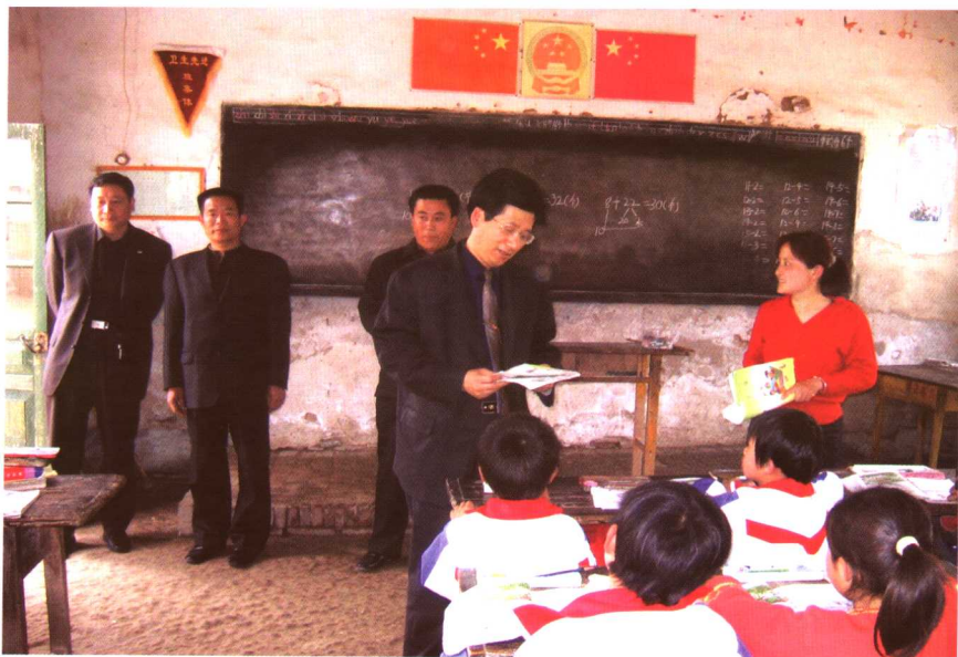
到学校调研教育负担情况