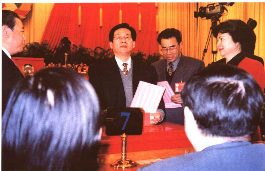
履行委员神圣职责