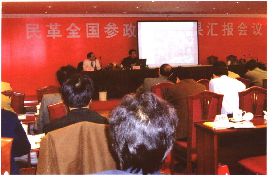
在民革全国参政议政成果汇报会上介绍经验