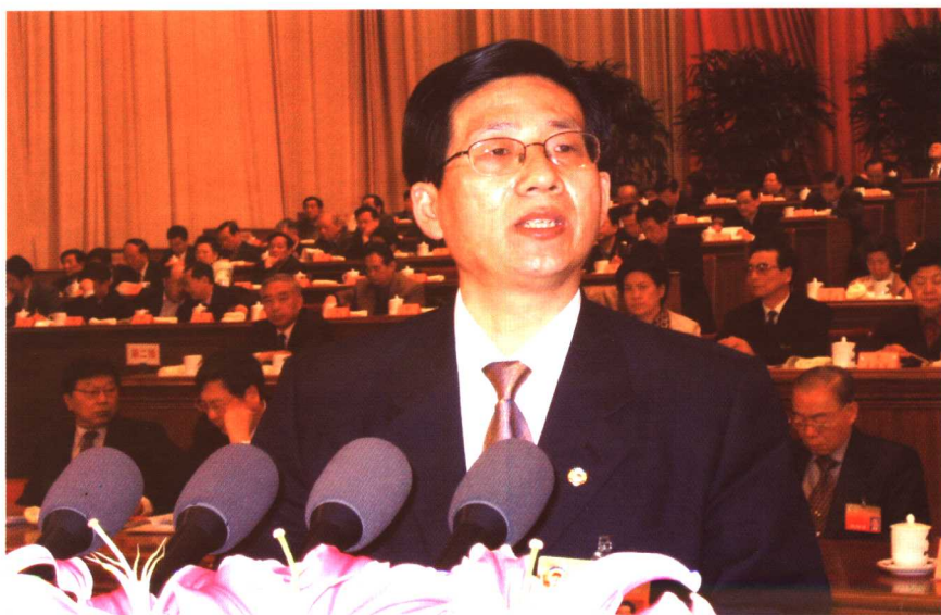
在全国政协十届二次会议上作大会发言