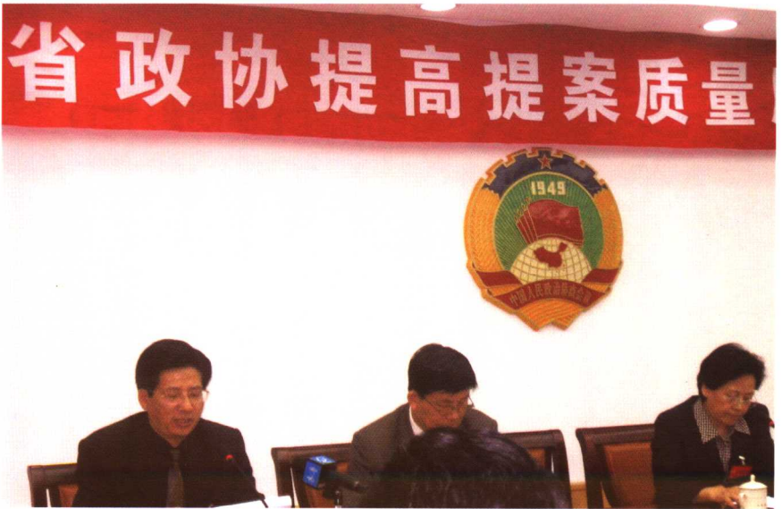
在山东省政协提高提案质量会议上介绍经验