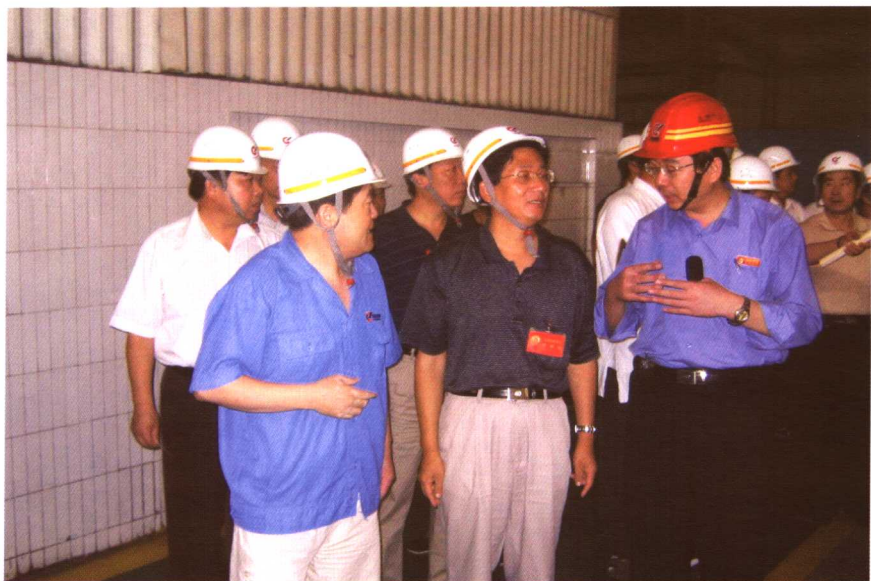
到工厂调研国企改革情况