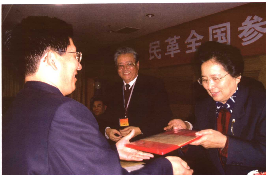
全国人大副委员长、民革中央主席何鲁丽亲自颁发参政议政贡献奖