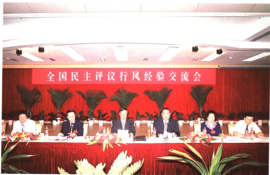
全国民主评议行风经验交流现场会在山东召开