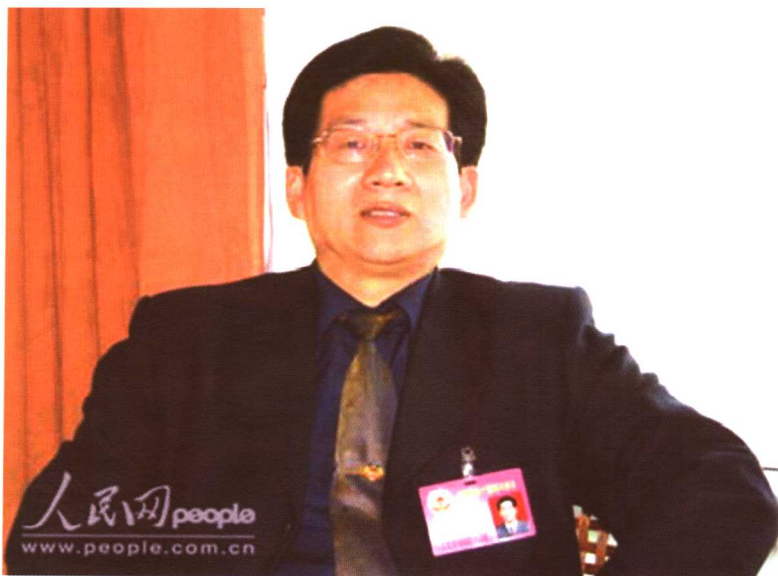
接受《人民日报》记者采访