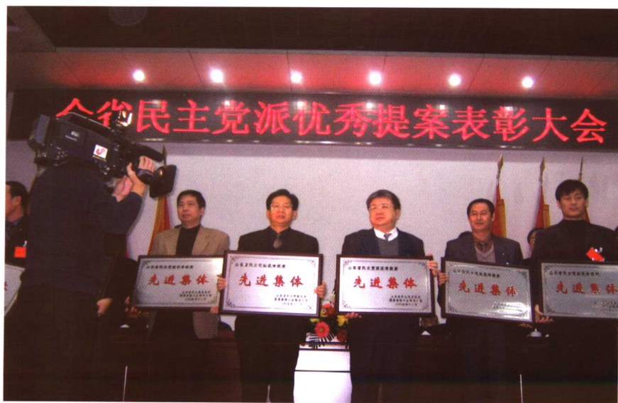
在全省民主党派优秀提案表彰会上领奖