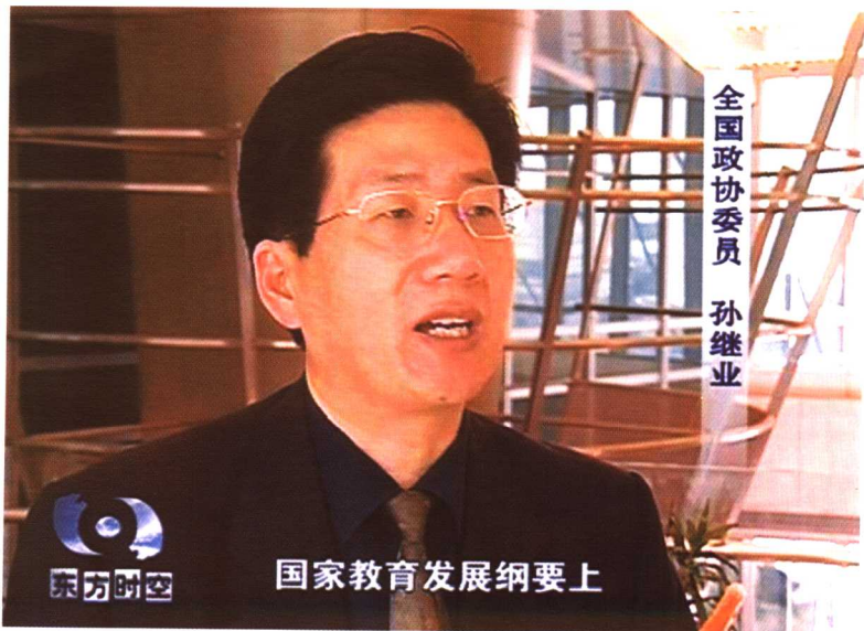
中央电视台播放《东方时空》专访节目