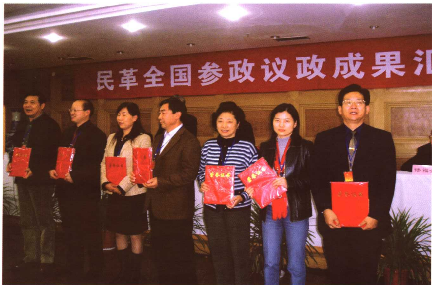
在民革全国参政议政成果会上领奖