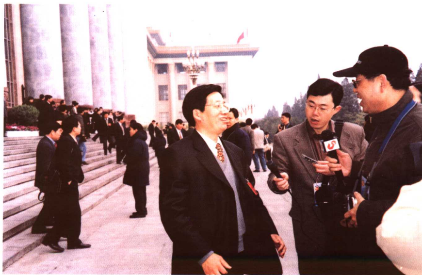
在人民大会堂前接受记者采访