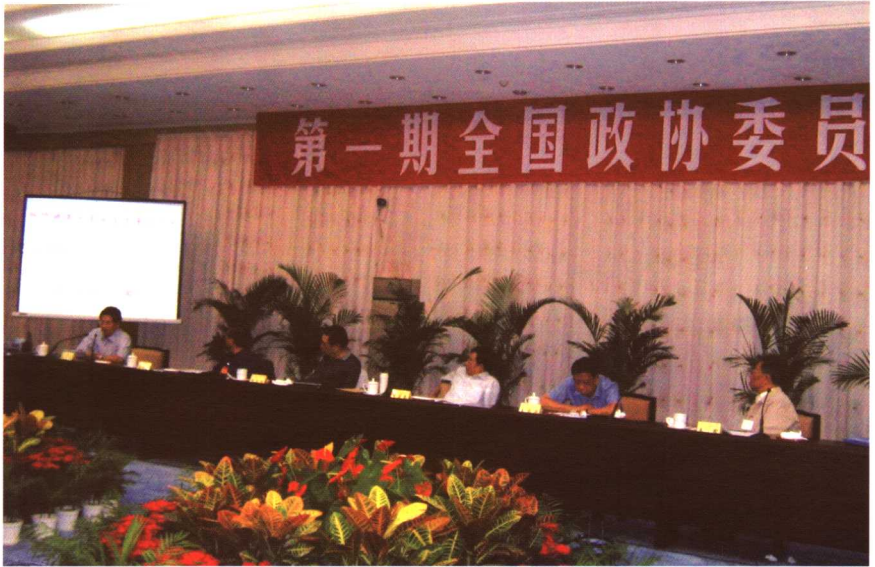
在第一期全国政协委员培训班上介绍经验