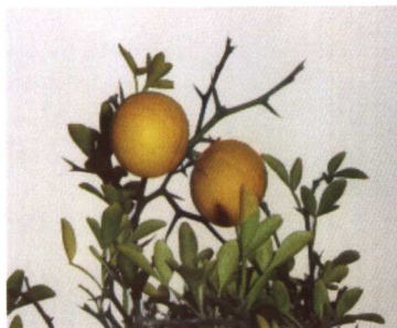
彩图15 枸橘 (枳实)