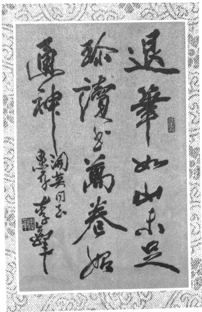
李 鋒 题 词