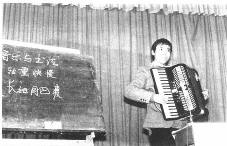
庞中华演讲《音乐和书法》