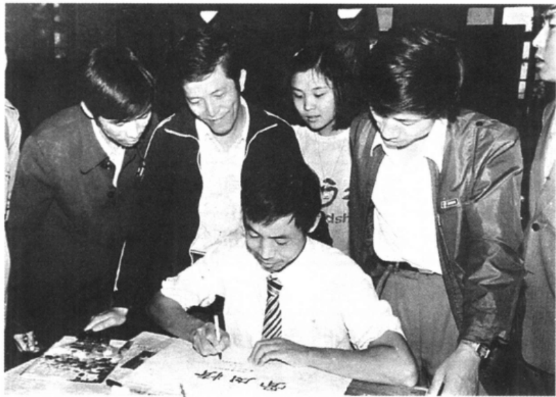
庞中华为北京师范大学台籍班同学讲课并题字