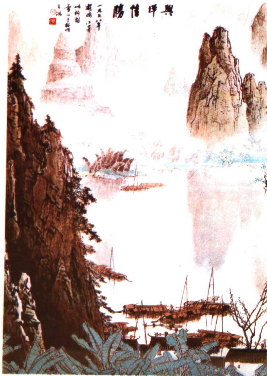
7 兴坪佳胜 1978