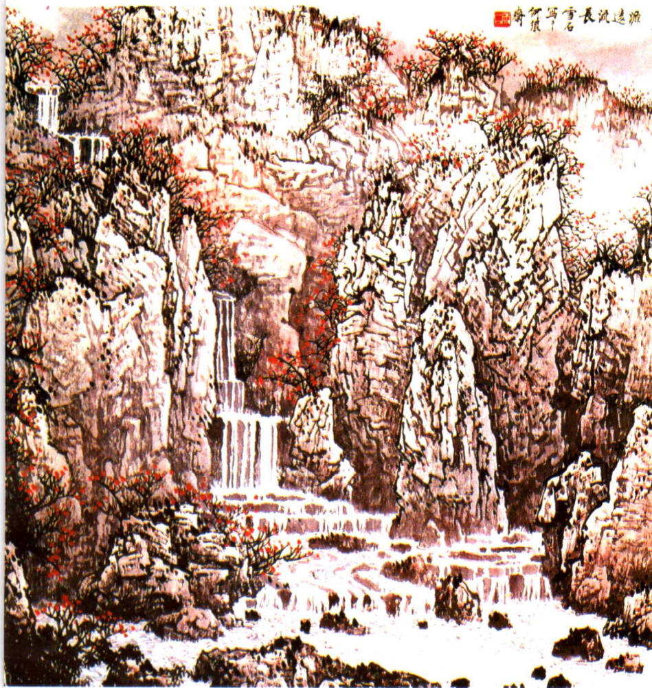
2 源远流长 1987