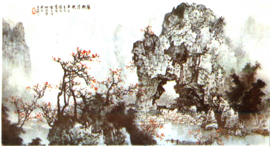
4 阳朔清秋 1991