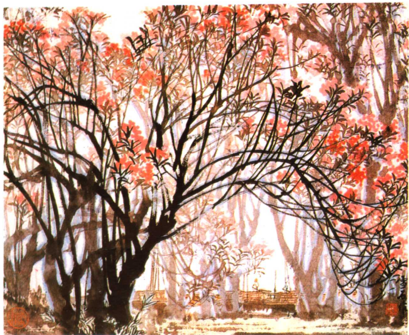
1 春江泊舟 1977