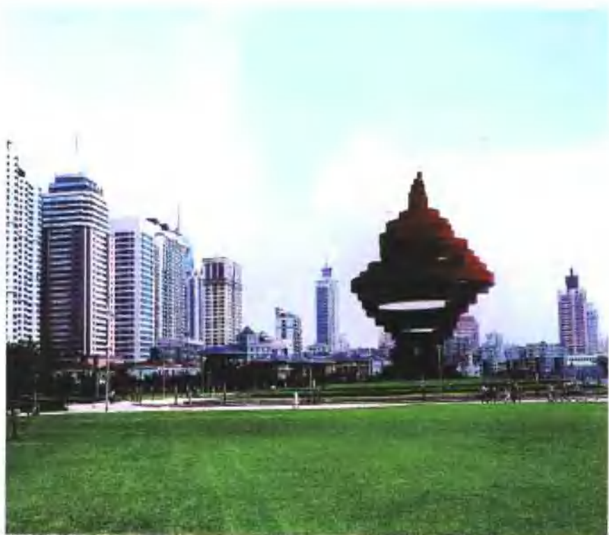
图3 美丽的青岛等待奥运会比赛项目的来临