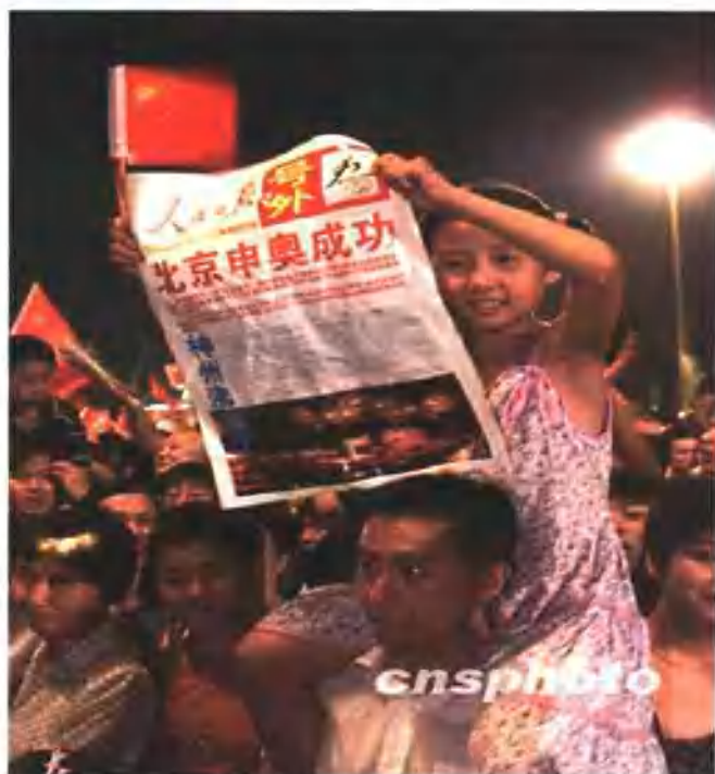
图2 首都群众庆祝北京申奥成功