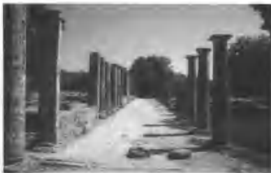
图 1-2 古奥运会比赛场遗迹

古奥运会从公元前 776 年起,到公元 394 年止,经历了 1170 年,共举行了 293 届。按其起源、兴盛、衰亡,大致分为三个时期: