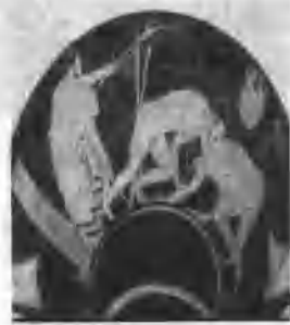
图1-8 古奥运会摔跤运动员