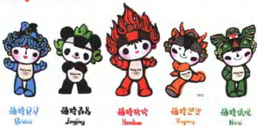
图4 北京奥运会吉祥物