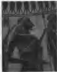
图1-7 古奥运会标枪运动员