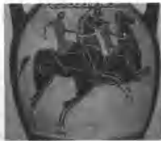
图1-4 古奥运会马术比赛