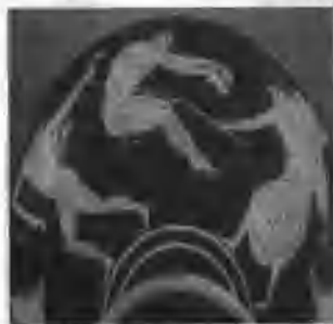
图1-6 古奥运会跳远比赛