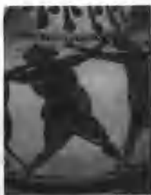
图1-3 古奥运会拳击比赛

古代奥运会给人类留下大量的艺术珍品,同学们可从力和美的角度来欣赏这些图片(图1-3~图1-8)。