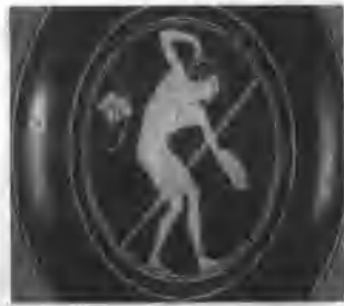
图1-5 古奥运会掷铁饼比赛