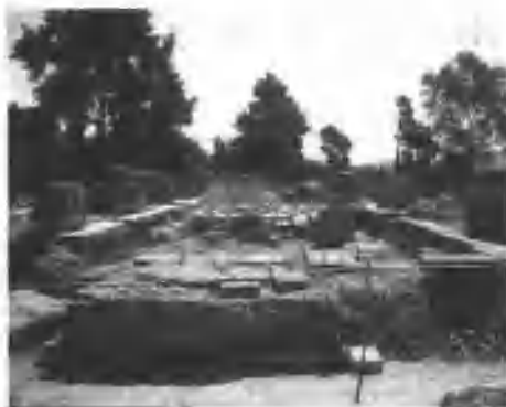
图 1-1 古奥运会比赛场遗迹

普遍渴望能有一个赖以休养生息的和平环境。后来古希腊斯巴达王和伊利斯王签订了“神圣休战月”条约，于是，作为准备兵源的军事训练和体育竞技，逐渐变为和平与友谊的运动会。