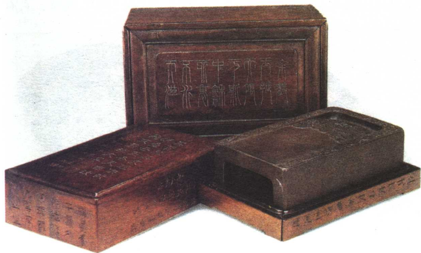
清 端石雕云龙纹抄手砚

端砚 端砚产于广东高要县之端溪，故曰“端砚”。就其所产之地名而名之也。端溪，位高要东三十三里，有山曰“斧柯”，在大江之南，盖灵羊峡之对山也。峻峙壁立，下际潮水。自江之涓，登山行三四里，即为砚岩。先至者，曰“下岩”。下岩之中有泉水焉。虽大旱，未尝涸。下岩之上曰“中岩”。中岩之上曰“上岩”。自上岩转山之背曰“龙岩”。龙岩者，唐时取砚之所也。后以下岩