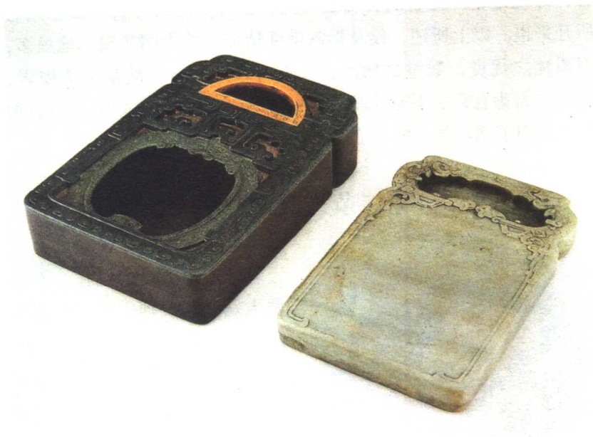
清 绿端石夔龙纹砚