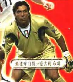
最佳守门员：意大利 布冯