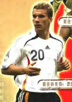
最佳新秀奖：德国 波多尔斯基