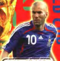
金球奖：法国 齐达内