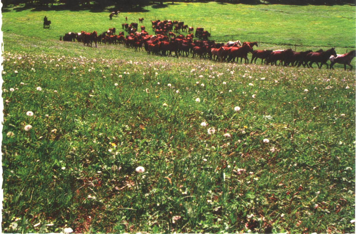
“五花草甸”