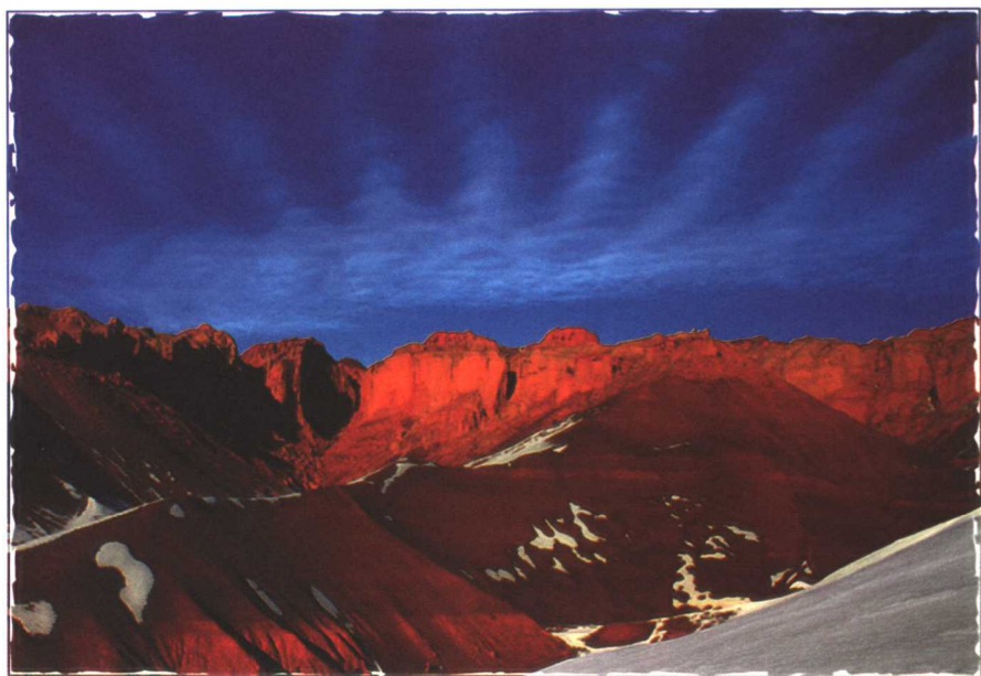
阿勒泰吉拉大峡谷