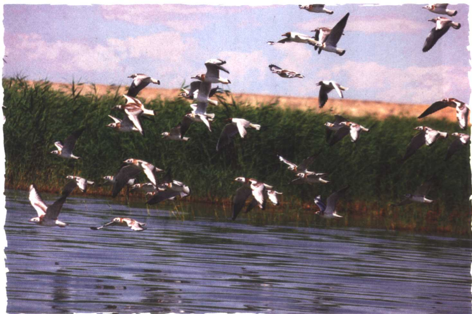
人与自然和谐相处