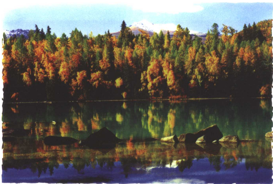
喀纳斯之秋