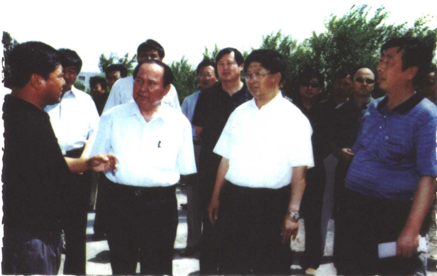
司马义·铁力瓦尔地同志在阿勒泰检查指导工作