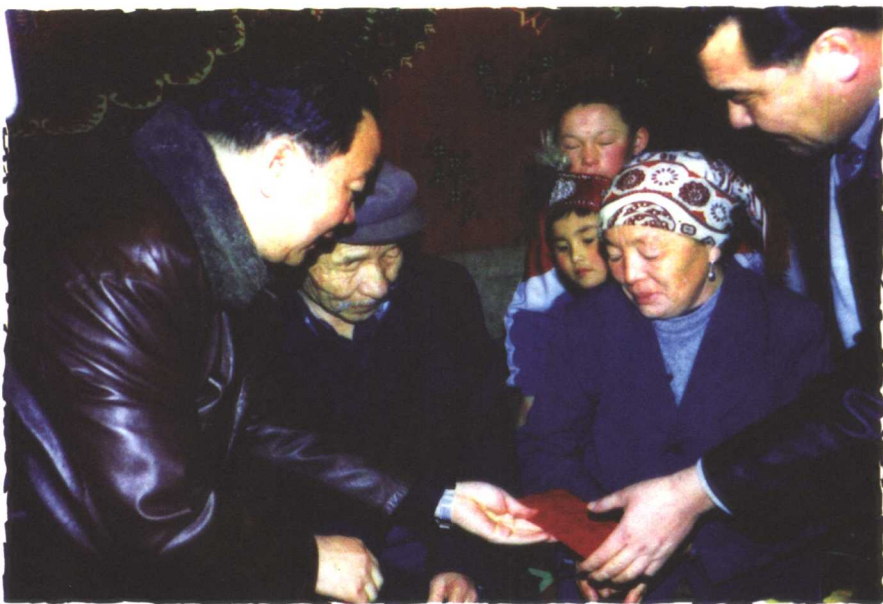
王乐泉同志在阿勒泰慰问英雄遗属