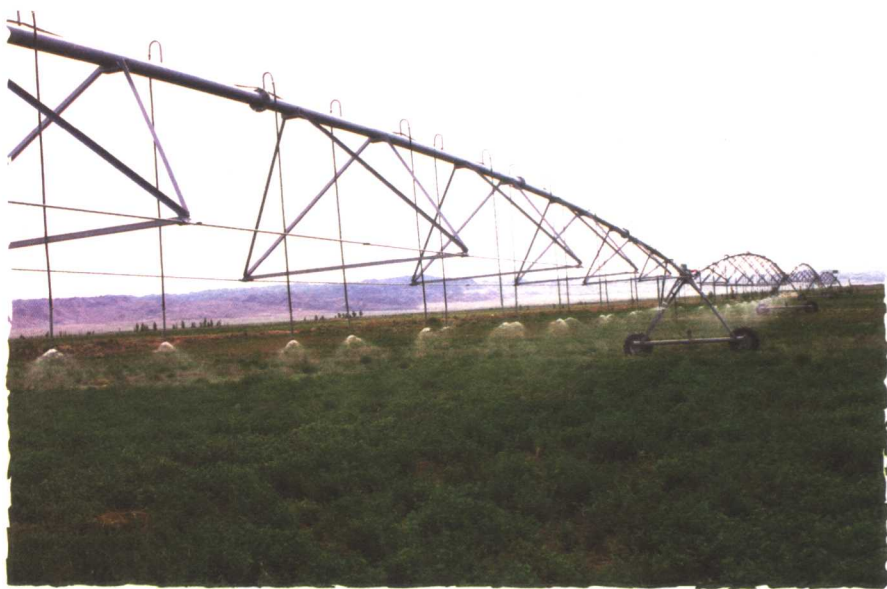
农牧业基础设施得到改善