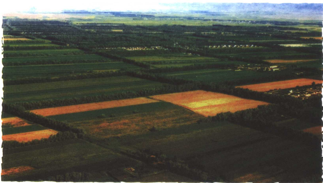
农田林网化