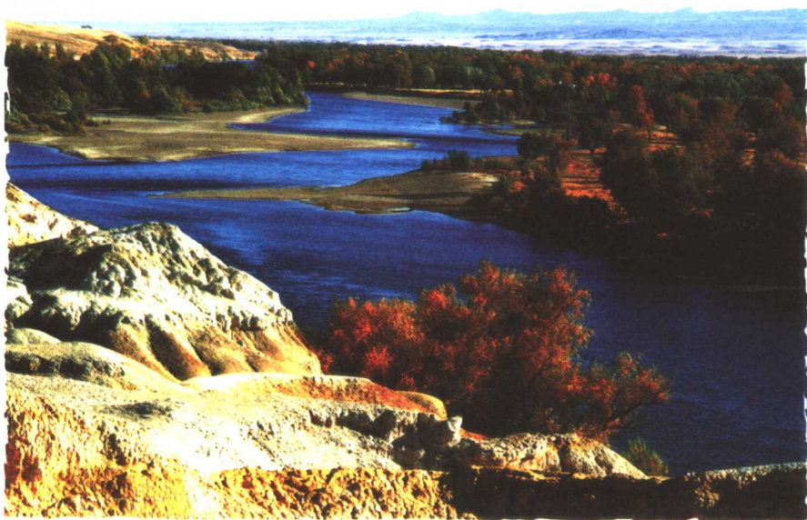
额尔齐斯河夕照