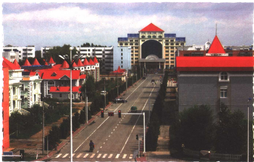
旅游使布尔津成为宾馆城