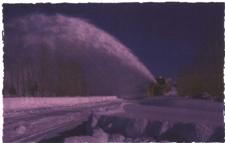
现代化的路面清雪机械