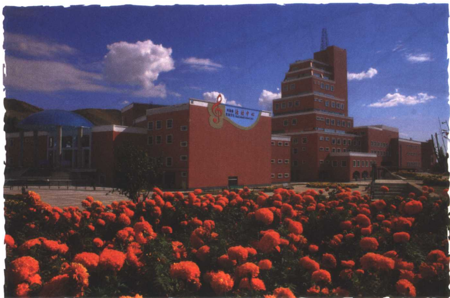
阿勒泰民族文化活动中心