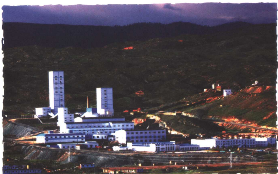
新疆最大的铜矿——阿舍勒铜矿