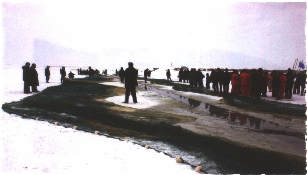
冬季到福海看“冬捕”