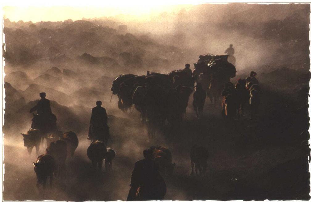
风雪大转场