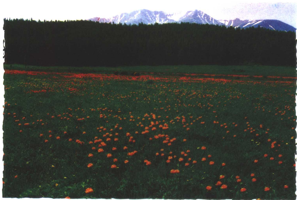
美丽的阿勒泰夏牧场