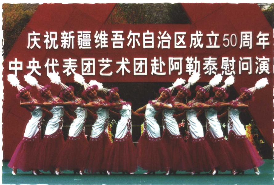
自治区成立 50 周年，中央慰问团来阿勒泰慰问演出