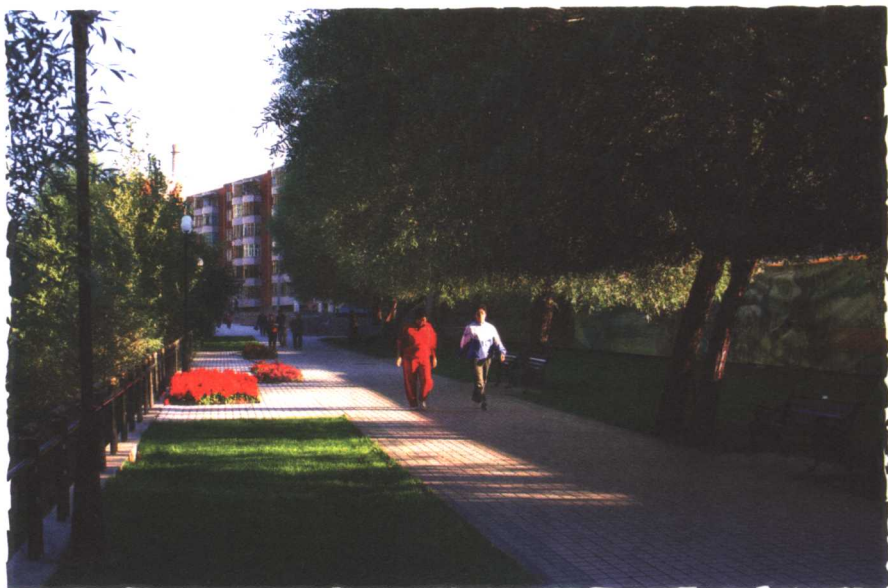
人民安居乐业