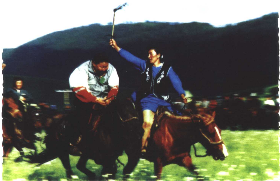
哈萨克传统文娱项目——姑娘追