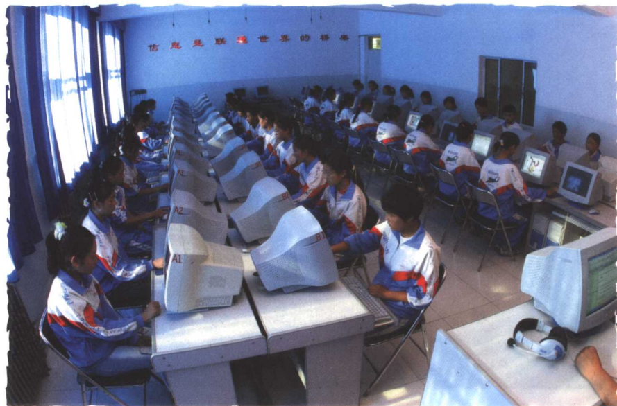
远程教育在农牧区普及