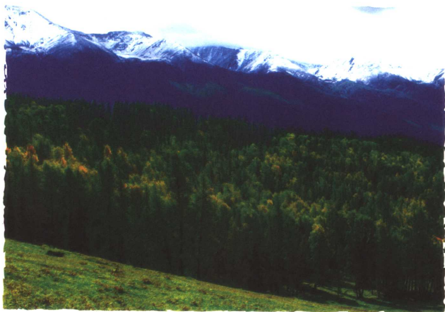
阿尔泰山“林海”