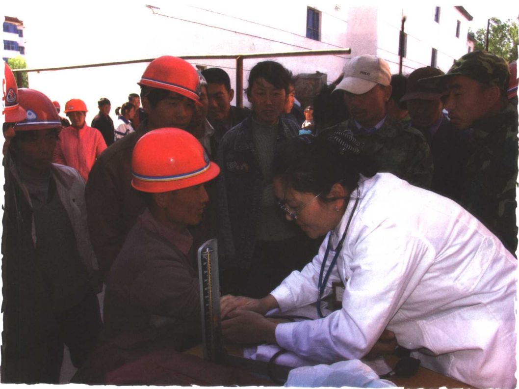
医疗条件明显改善