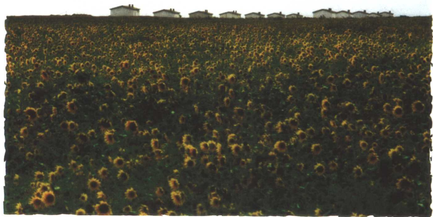
牧民定居点一瞥