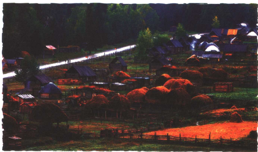
白哈巴村