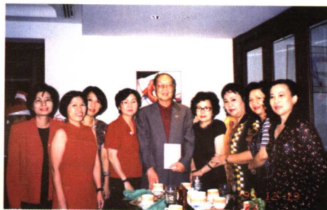
1998年在新加坡与学生们欢度圣诞节。