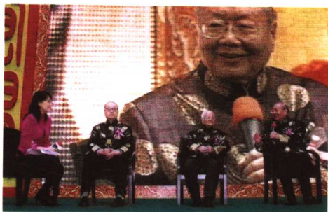
2006年在广东省中医院名师带高徒结业仪式上，邓铁涛（中）、朱良春（右）、唐由之（左）三位导师接受中央电视台节目主持人洪涛的访谈。