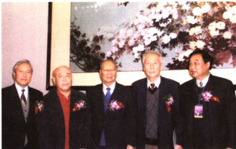
在北京与原卫生部胡照明副部长（左2），国家中医药管理局田景福（左4）、诸国本（左1）两位副局长，陕西中医学院张学文教授（右1）合影。