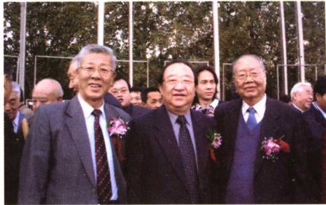
2005年与国家卫生部朱庆生副部长（中）、中国中医研究院傅士垣院长（左）在第二届中国中医药发展大会合影。