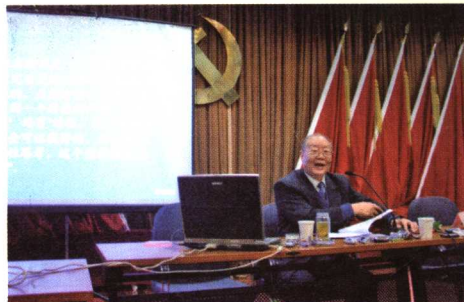
2005年应北京中医药大学之邀，于“博导论坛”作学术报告，受到师生的热烈欢迎。