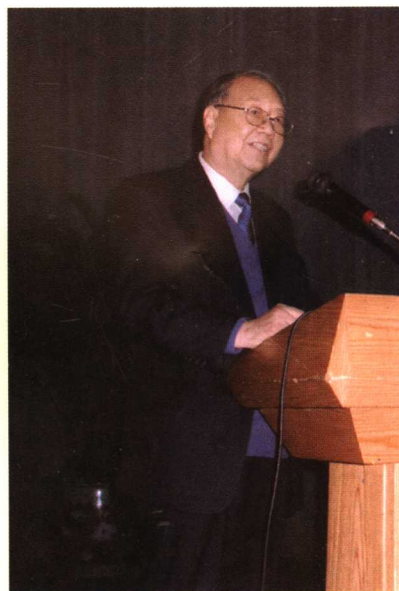
2005年在第二届中医发展大会代表老中医讲话。