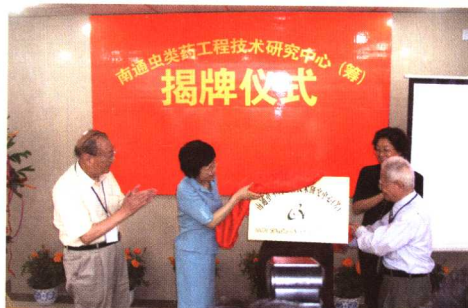
2005年余靖副部长（中）和中医泰斗邓铁涛（右）为“南通虫类药工程技术中心”揭牌。