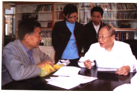
2006年5月在为病人诊治。