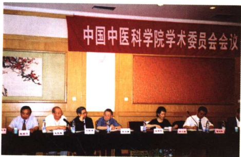
2006年中国中医科学院学术委员会首届会议，朱良春（左2）在发言。