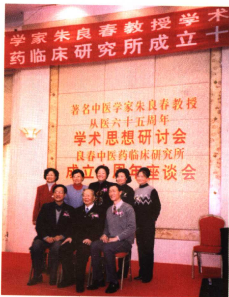
2002年朱良春教授从医65周年学术思想研讨会时与子女合影。