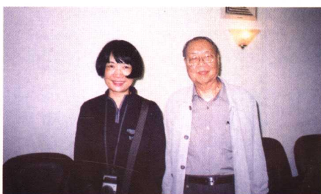
著名作家陈祖芬女士采访后合影。