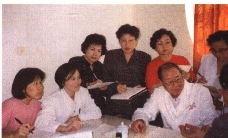
在厦门国际中医培训交流中心带教新加坡进修医师。