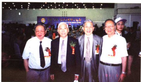
2001年在天津参加中国首届中医药文化节，与陈可冀（左1）、陈灏珠（左2）、沈自尹（左3）三位院士合影。