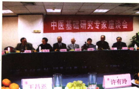
2003年在广州参加国家中医药管理局召开的“中医基础研究专家座谈会”。