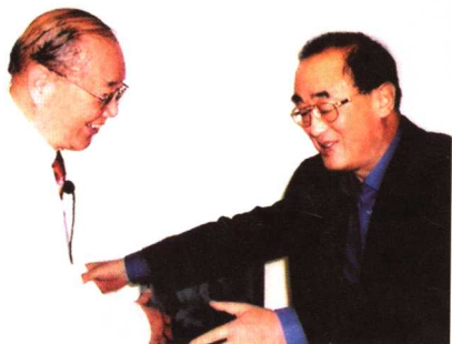
2006年卫生部高强部长在广东省中医院专家工作室看望九十高龄的朱良春教授。