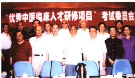
2003年参加国家中医药管理局“优秀中医临床人才研修项目”考试委员会工作会议。