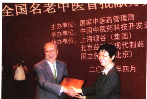
2005年国家中医药管理局主办“全国名老中医首批献方大会”，卫生部副部长、国家中医药管理局局长余靖颁给朱良春奖牌。