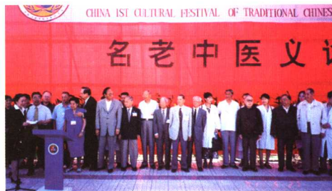
参加中国首届中医文化节后，名老中医进行义诊。