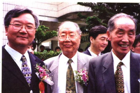
2001年与卫生部张文康部长（左）、任继学教授（右）合影。