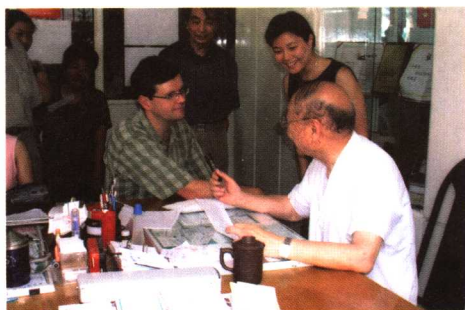
2005年为德国病人诊治慢性腹泻。