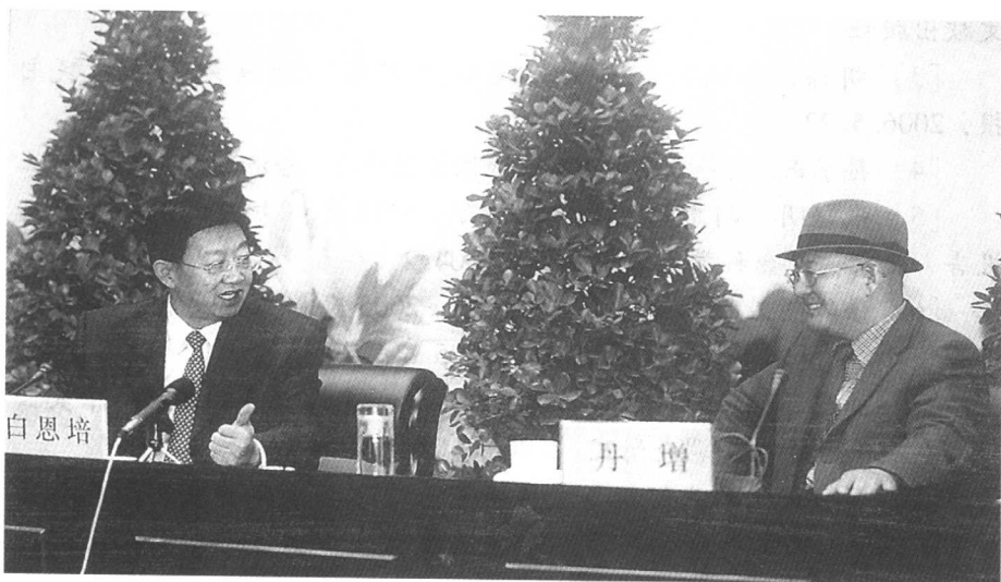
云南省省委书记白恩培（左）与省委副书记丹增（右）在云南文化产业高级研讨会上

在国内外文化产业大发展的背景下，在党的十六大提出文化体制改革和文化产业发展精神的指导下，中共云南省委、省人民政府作出了加快文化体制改革、发展文化产业、建设民族文化大省、培育文化产业支柱产业的战略决策，推动了云南文化体制改革和文化产业发展扬帆起航。