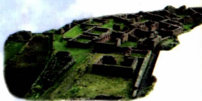
玛雅文化是北美洲文明，也是世界古代文明史上的一颗明珠……