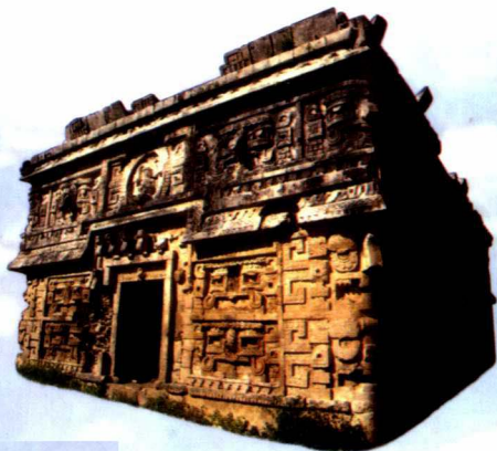
玛雅文化具有悠久灿烂的历史，其神秘伟大的公元后1000—1500年，一直延续到公元1524年，可分为前古典期（公元后1000年—公元1200年）、古典期（公元1200年—1500年）和后古典期（公元1500年—1524年）三个阶段。