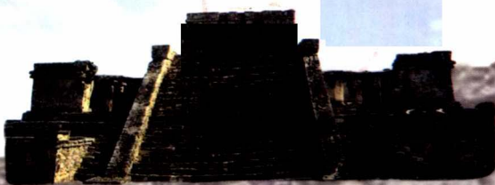
玛雅文化是美洲著名的古文明之一，也是于美洲三大古文明之一，它是由印第安人创造的，对美洲印第安文化的影响，和玛雅文化具有相似性。