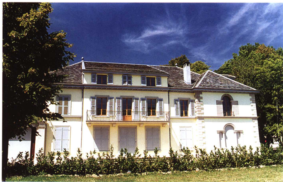
中国代表团在日内瓦的驻地——花山别墅。