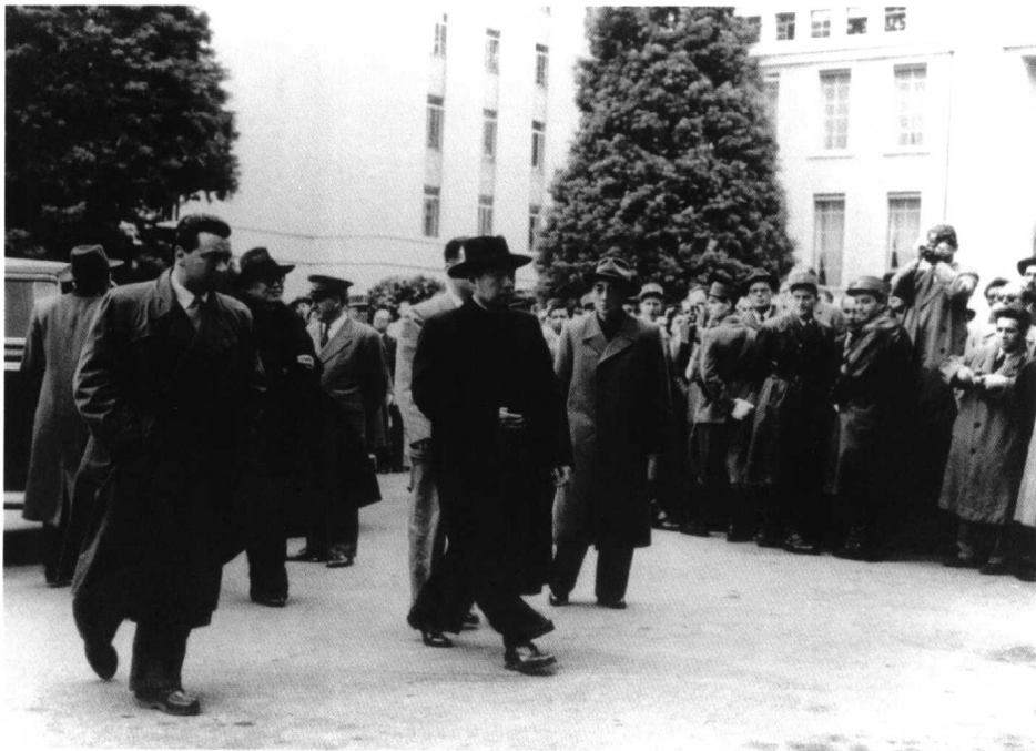
周恩来步入日内瓦会议会场。