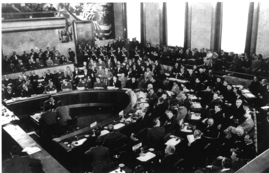
讨论朝鲜问题会议会场。