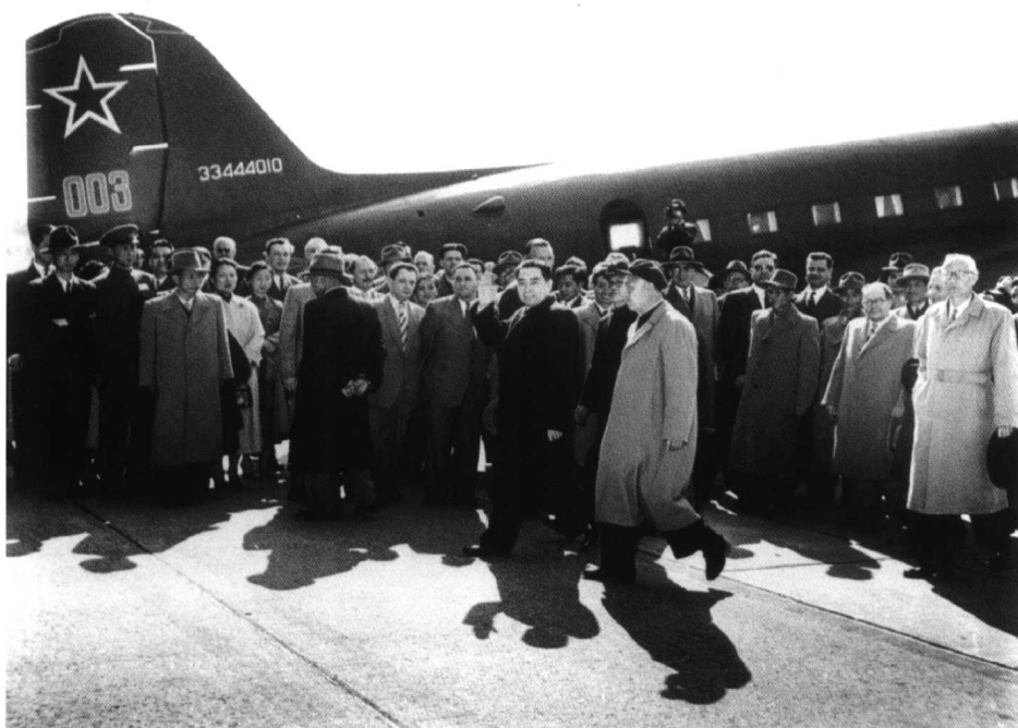
中国代表团首席代表、政务院总理兼外长周恩来率代表团抵达日内瓦。(1954年4月24日)