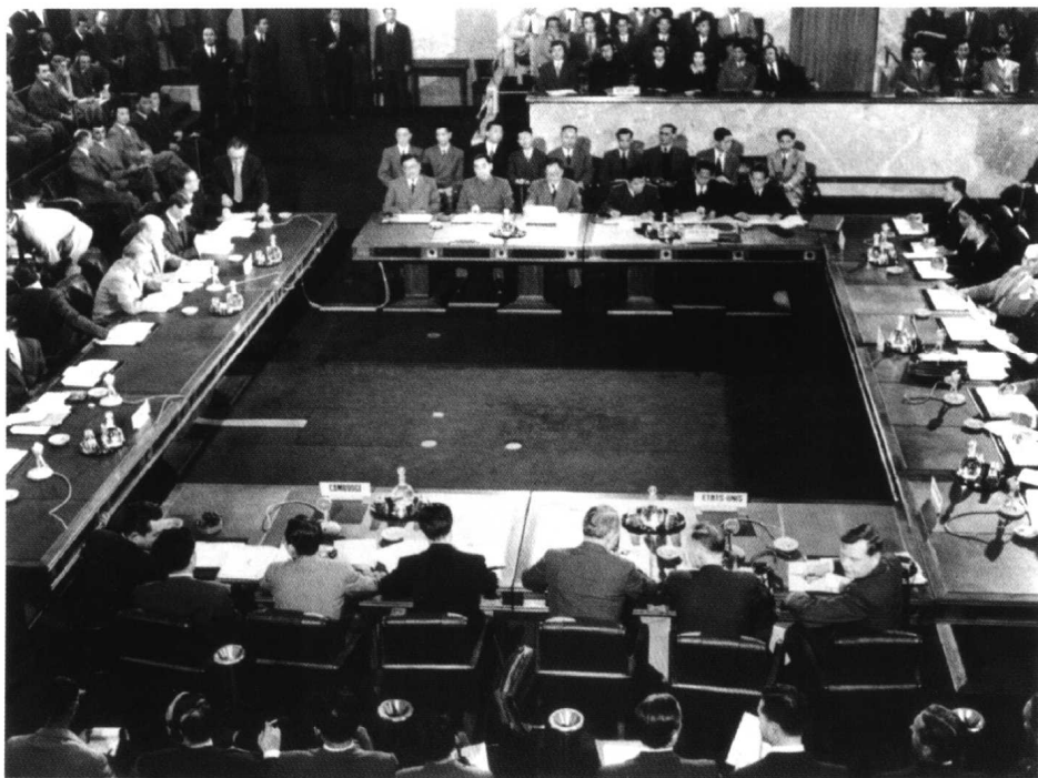
讨论印支问题会议会场。