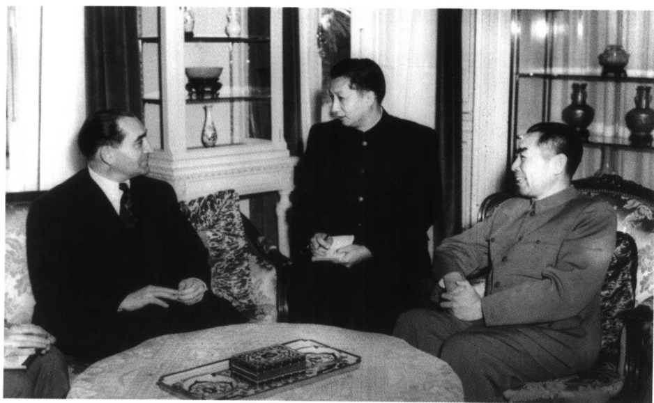
周恩来在驻地会见法国总理兼外长孟戴斯-弗朗斯（1954年6月23日）。