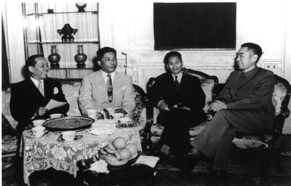
周恩来在驻地会见并宴请印支三国代表团团长。左起：老挝副首相萨纳尼空、柬埔寨外交大臣狄普芬（又译泰普潘）、越南民主共和国副总理兼代外长范文同。（1954年6月21日）