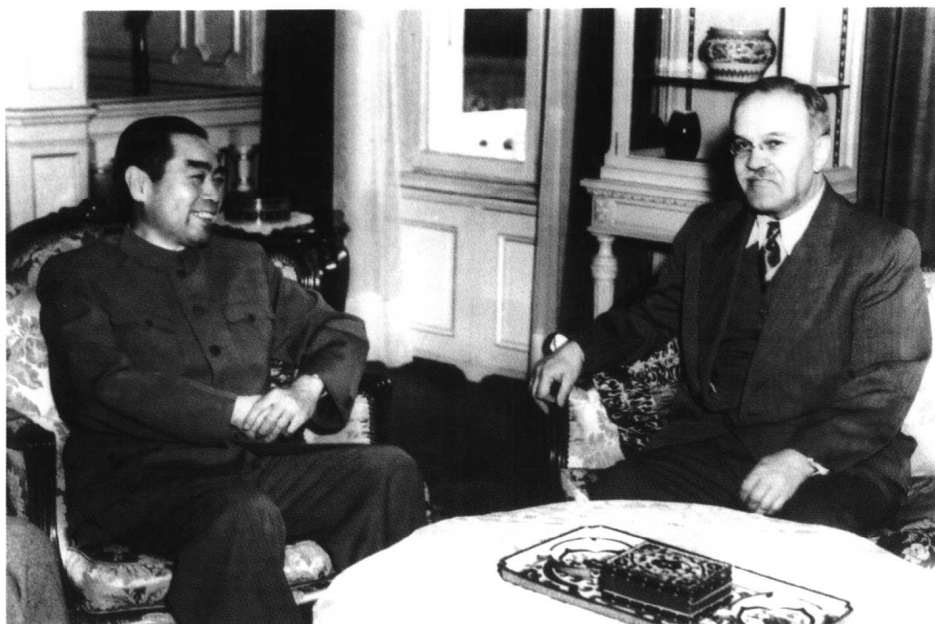
周恩来在驻地会见苏联外长莫洛托夫。