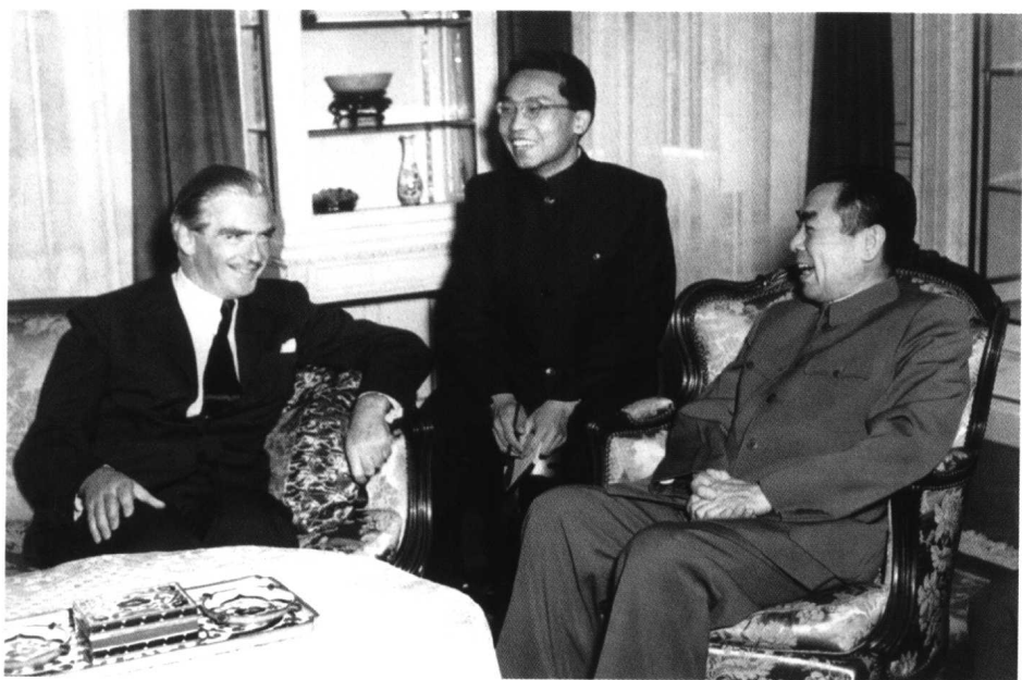
周恩来在驻地会见英国外交大臣艾登（1954年5月）。