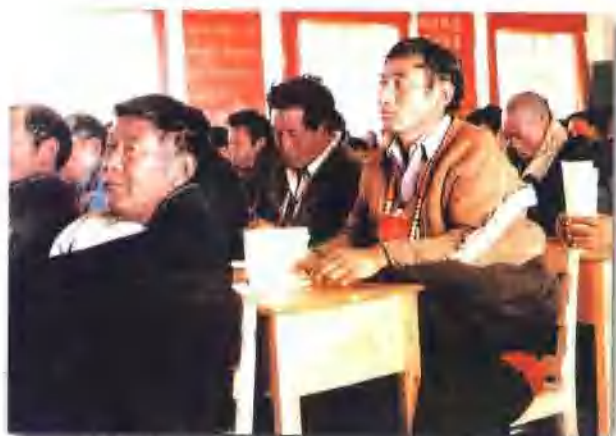
§ 代表们聚精会神听报告