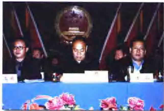
§ 碌曲县人民代表大会