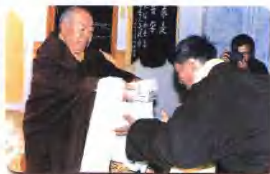
甘肃省政协副主席贡唐仓·丹贝旺旭为碌曲教育捐款