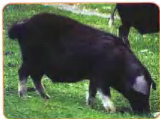
§ 合作猪 (藏麻猪)