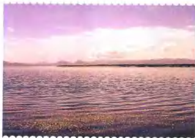
§ 高原明珠——尕斯库勒湖