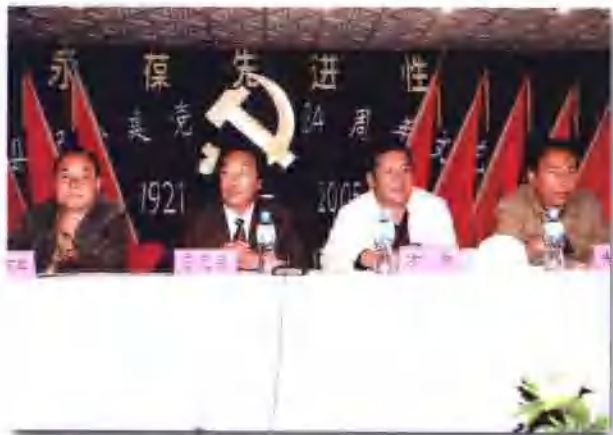
§ 县四大班子领导在保持共产党员先进性教育动员会上