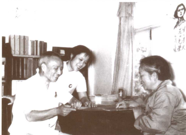
▼ 纹枰之趣 (1974年在家中与妻女下棋)