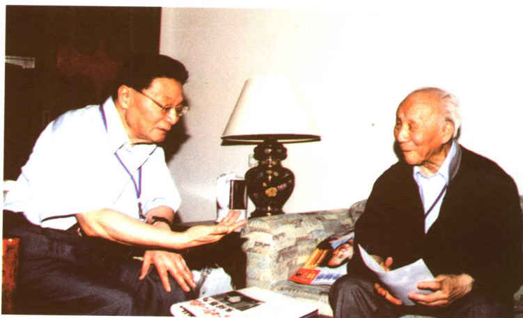
两院院士潘家铮探望老师▶ (2004)