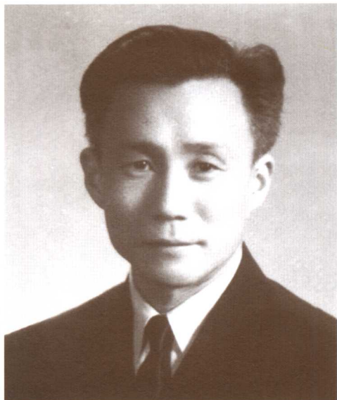
△ 年轻有为 志存高远