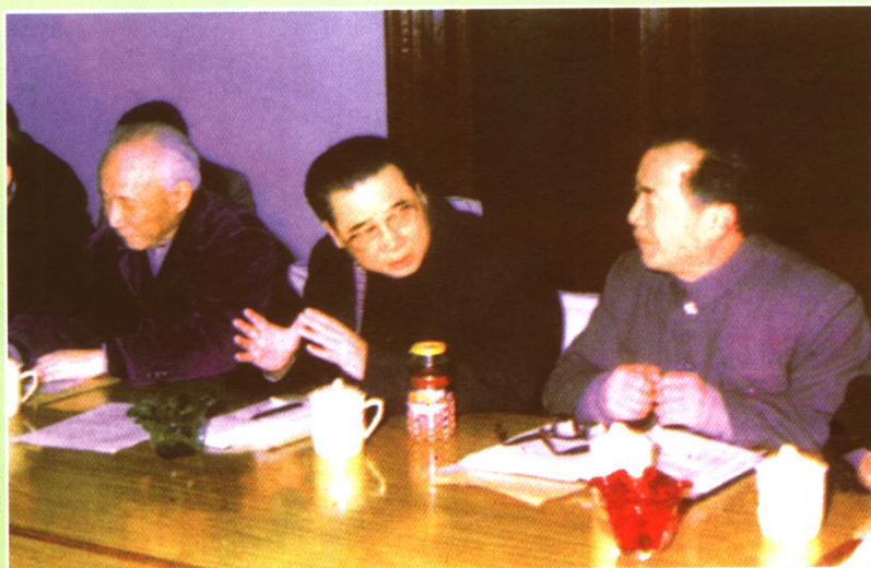
◀ 钱令希院长、金同稷书记 迎接李鹏总理到校视察 (1986)