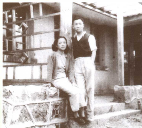
△ 边陲三千里 甘苦与共 相敬如宾 （婚后在昆明小石坝）