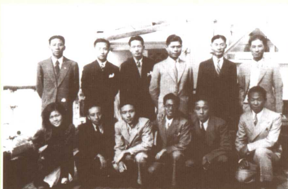
▲ 1936年赴比利时留学在船上