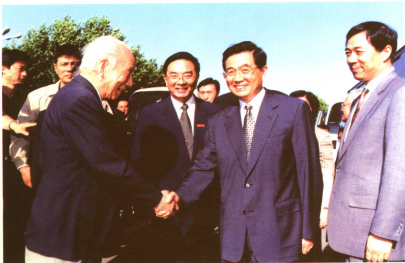
◀ 欢迎胡锦涛同志视察 大连理工大学 (2002)