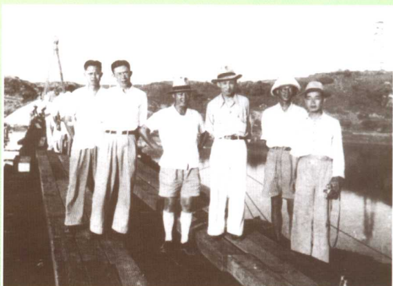
▲ 1939年在云南参建叙昆铁路