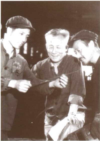
▲ 在大连造船厂与工人融洽相交 ▼ 研究鲛鱼湾输油栈桥设计方案 (1974)