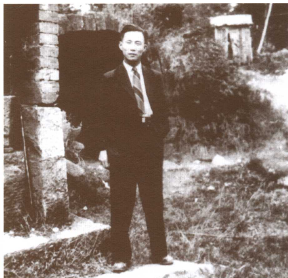
△ 振国兴邦 风华正茂（1940年在云南）