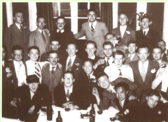
▲ 1938年在比利时布鲁塞尔自由大学获“最优等工程师”学位