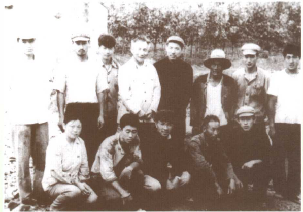
在庙岭大队指导农民用树枝建房▲ 在鲛鱼湾栈桥工地指导施工 (1975)▼