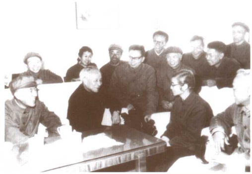
▲ 与各系栋梁交流兴校大计