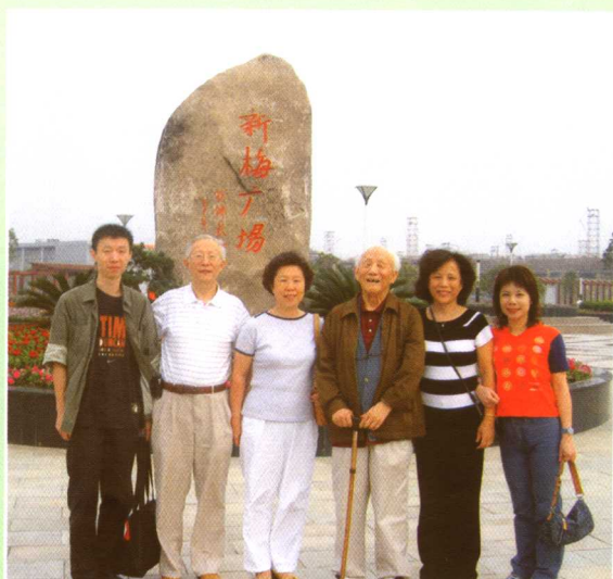
▲ 八十八岁携儿孙重归故里 (2004)