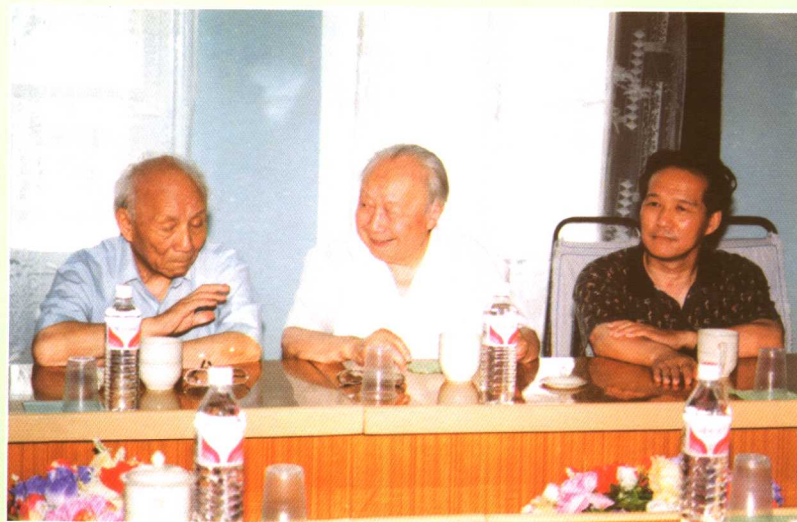
新老院长欢迎力学界老同行 ▶▶ 钱伟长校长