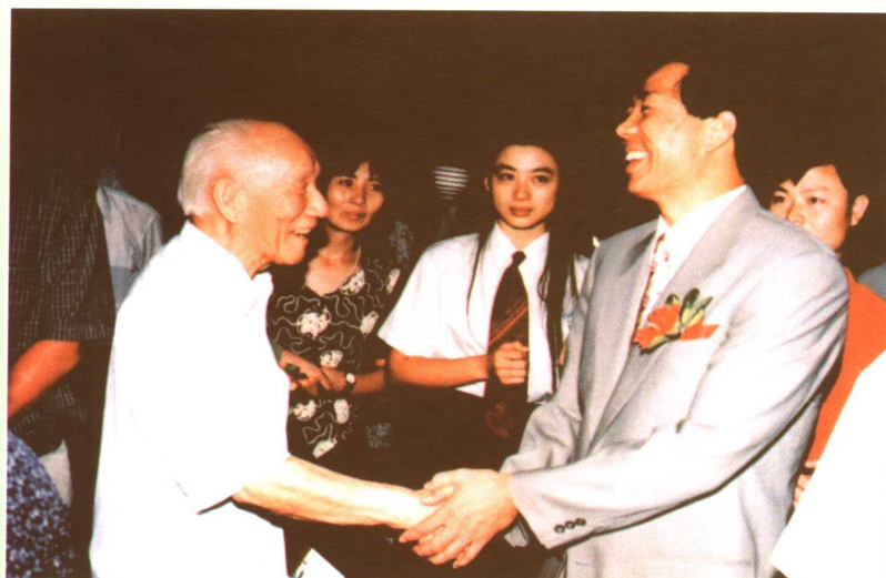
◀◀ 与老朋友薄熙来市长小别重逢