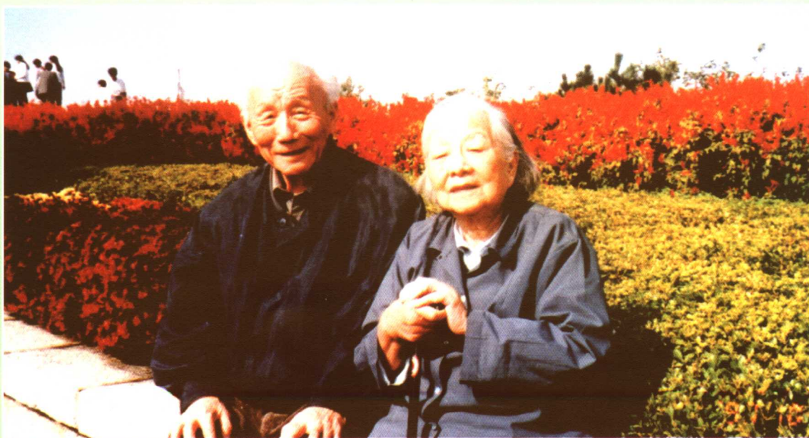
△ 风雨六十载 相濡以沫 恩爱如初（钻石婚在大连欢度）