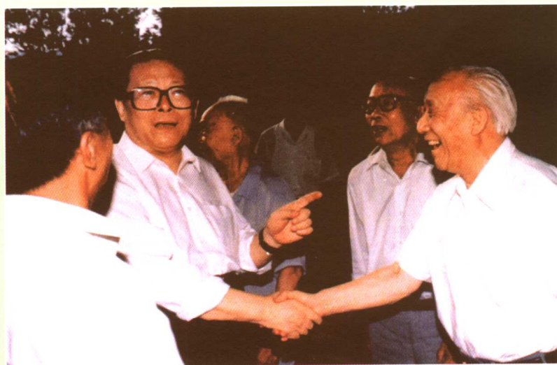
欢迎江泽民总书记访问 ▶ 大连理工大学 (1993)