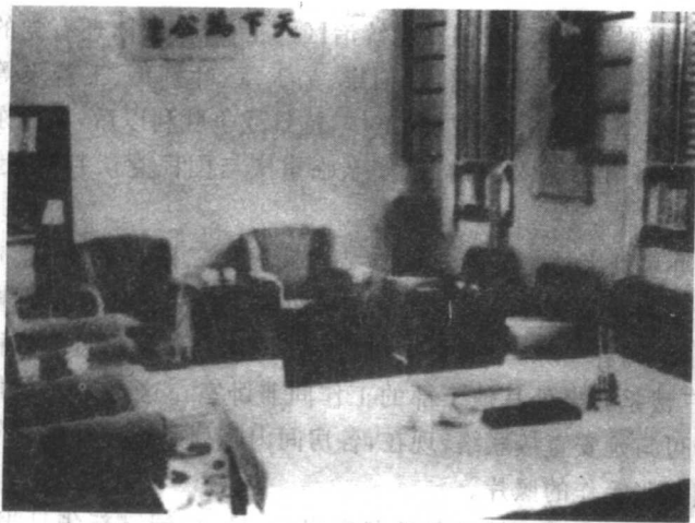
毛泽东在重庆期间，张治中特地腾出自己的公馆桂园作为毛泽东办公和会客的地点。

楼浅院，别有一番幽静。正房前阶，立柱高廊，宽敞轩豁；廊上阳台，围遮护栏，淡雅古朴。入门面对走道，有木梯回折而上楼层。底层左右一大一小前后两间，大则客厅、餐堂；小则住室。1945年8月，毛泽东同志应蒋介石三次电促，并着张治中先生亲赴延安迎接，飞来重庆举行中外关注的国共两党和平谈判，治中先生为促成和谈，毅然让出桂园，作为毛泽东同志的市内活动寓所。各界人士前来晤谈，共商国事，络绎不绝，一时誉为和谈名寓。十月十日。国共和谈“双十协定”的签字仪式，就在这底层的右侧客厅里举行，使其成为具有重大历史意义的著名纪念地。至今厅内布置，仍然保留原状，以供参观。