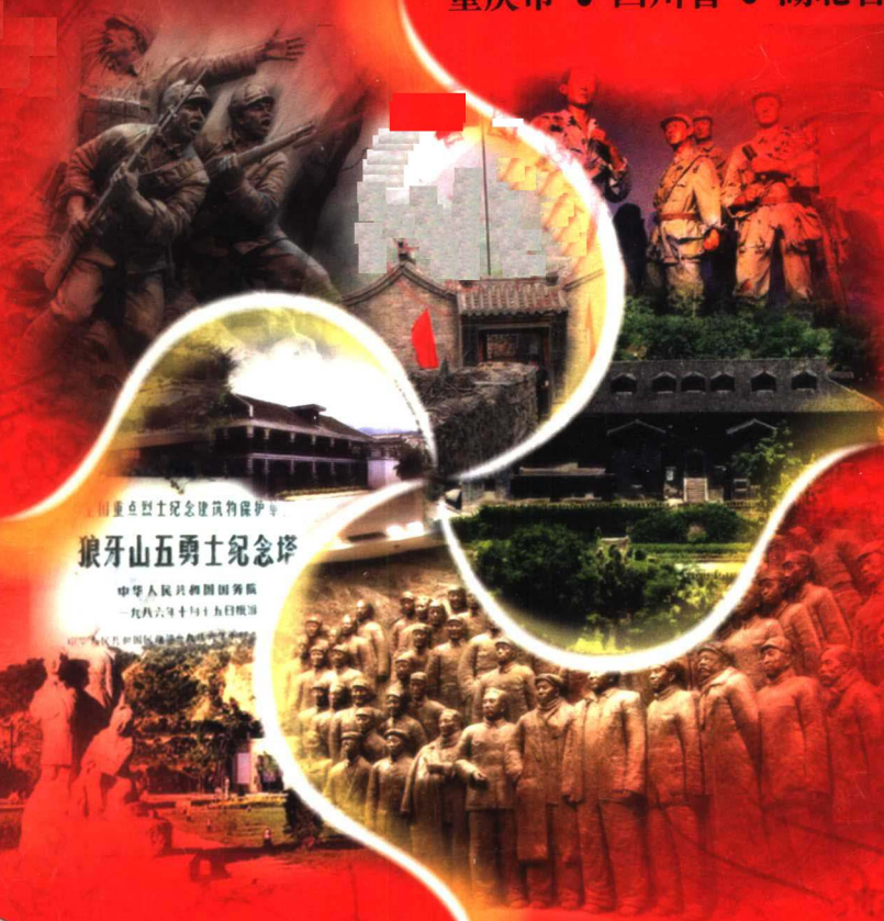
国家重点文物保护单位 狼牙山五勇士纪念碑