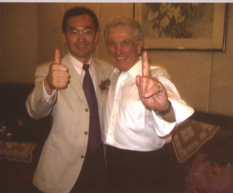
与乔·吉拉德在一起