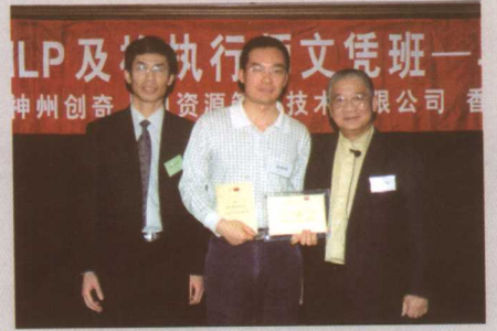
著名华人NLP大师李中莹先生授 “NLP及格执行师”证