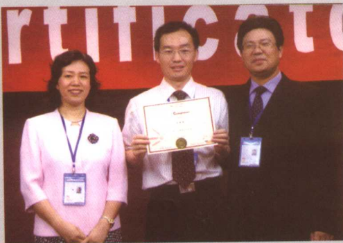
接受国际教练协会 (IAPC) 的教练资格认证