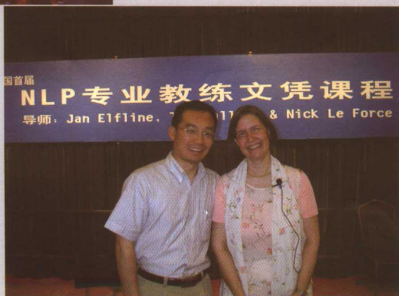
与国际教练大师珍·雅芬在一起