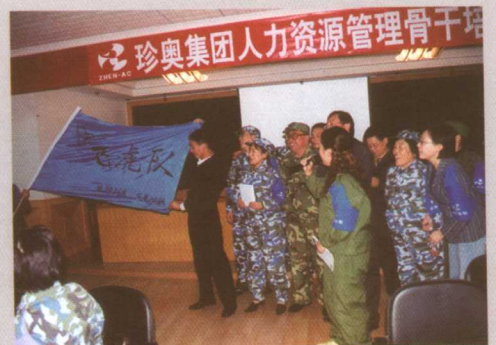
珍奥核酸人力资源管理高级骨干培训班