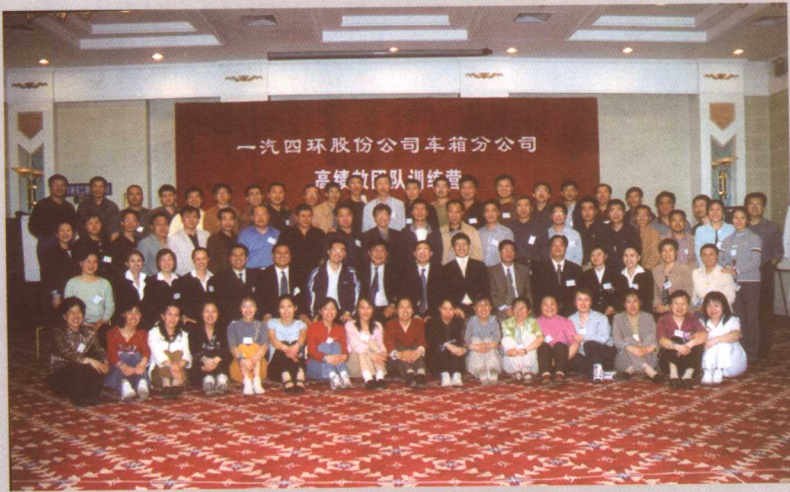
2004年8月为上市公司一汽四环做培训