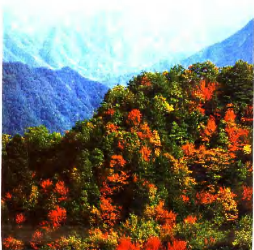
▲ 高县五马寺林场秋色