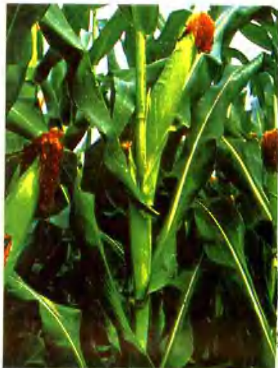
偃师县玉米高产开发