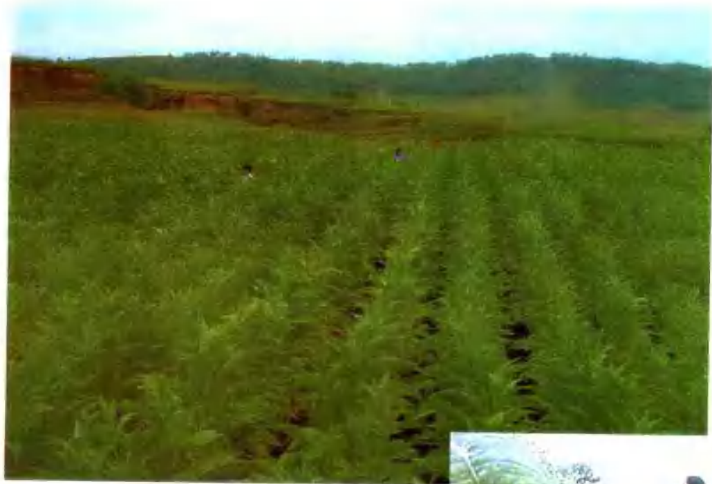
▲ 洛宁县优质烟生产基地