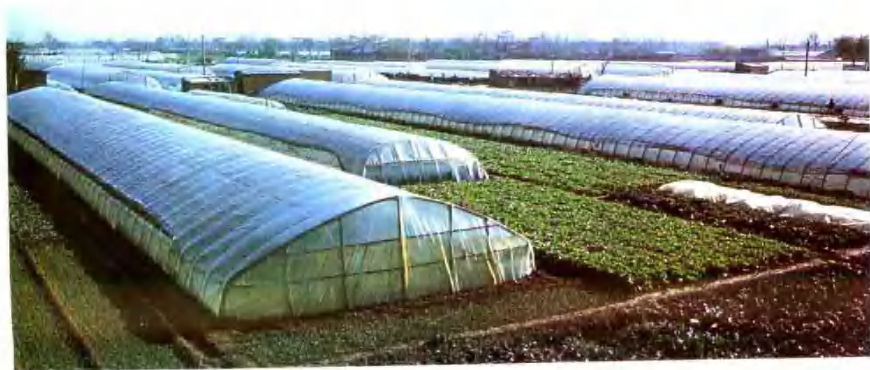
▼ 郊区李楼乡蔬菜大棚