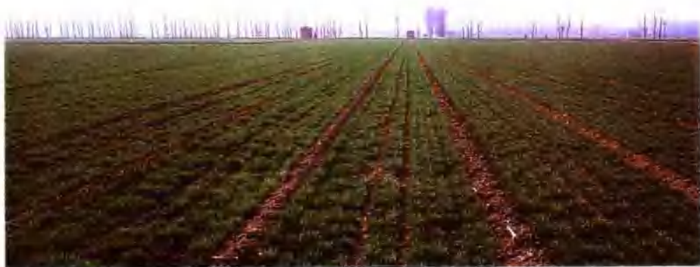
▲ 禹和区旱涝保收麦田