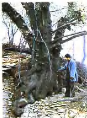
▲ 新安县荆条山的高栎树