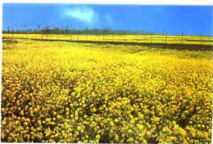
▲ 宜阳县油菜花飘香