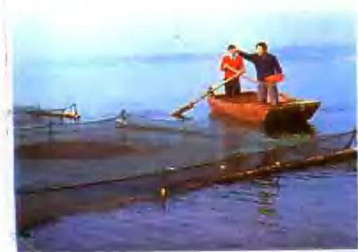
▲ 陆浑水库网箱养鱼