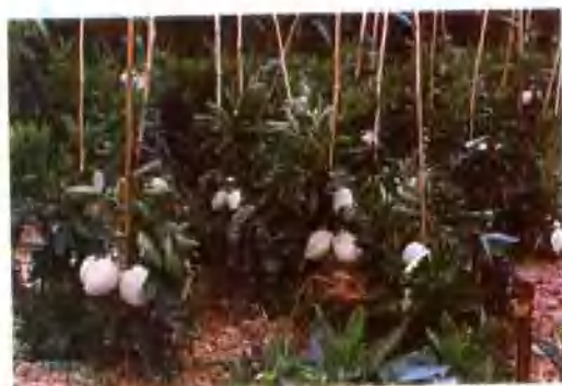
▲ 市农技站从美国引进的人参果