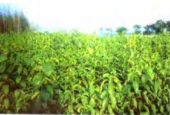
▲ 汝阳县三屯乡千亩杜仲基地