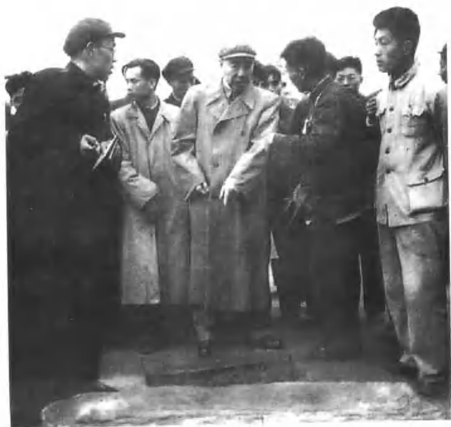
▲ 1958年4月25日，国务院总理周恩来视察偃师县东寺庄地下管道工程