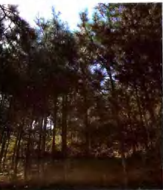
▲ 梁川县十八年生的飞播油松