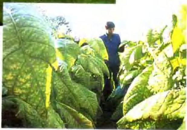
▲ 红花大金元烟长势喜人