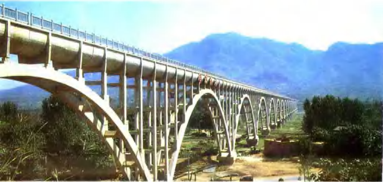
▲ 陆浑西干渠大渡槽