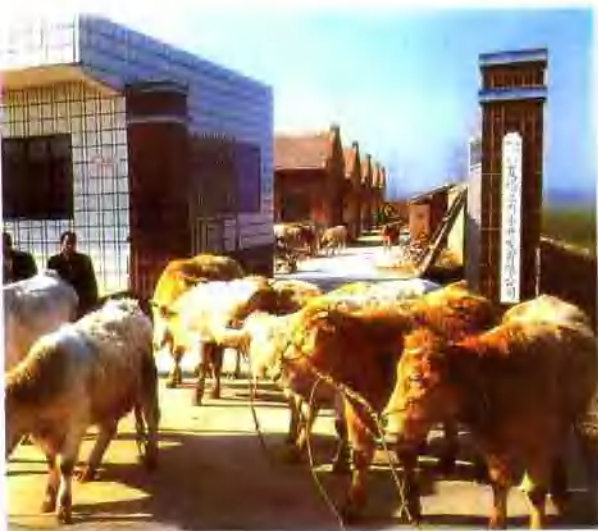
▲ 伊川县夏塔兰肉牛养殖场