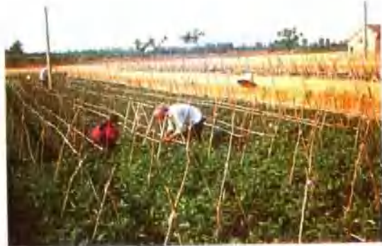
▲ 孟津县白梨西番茄良和繁育基地