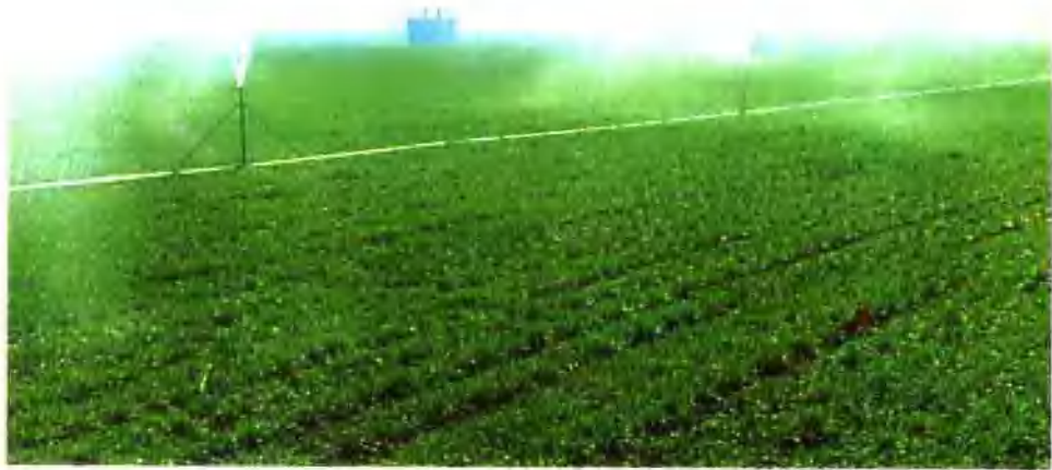
▲ 偃师县农田现代化灌溉