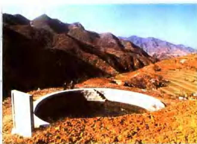
▲ 汝阳县十八盘微积水工程