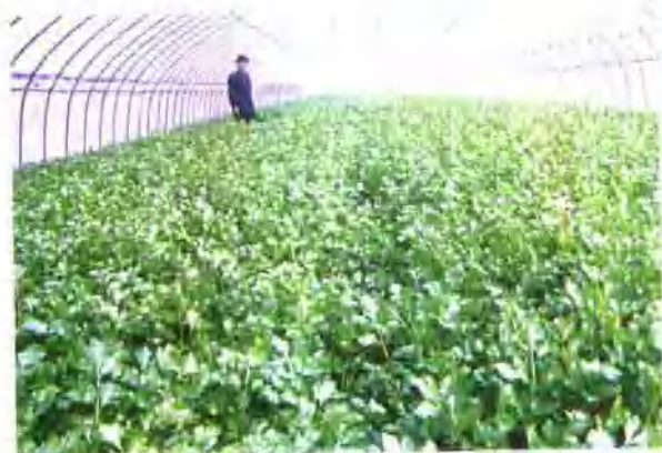
▲ 偃师县日光温棚芹菜