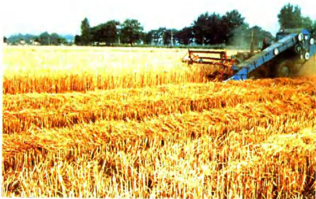
▲ 地区机械化收割小麦