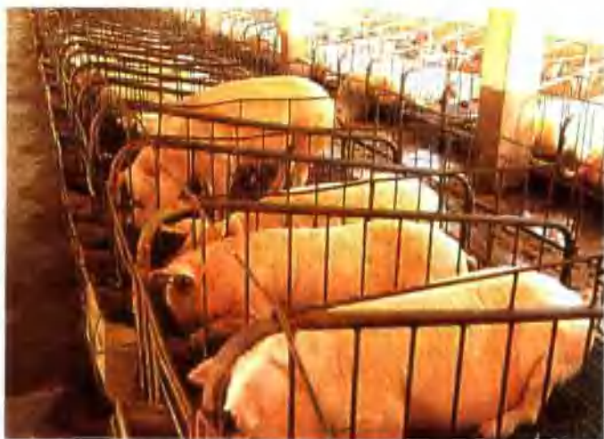
▲ 德顺县西坡村养猪场