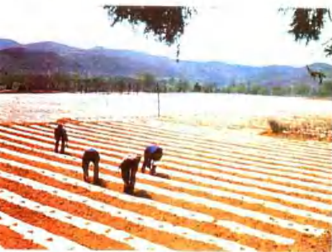
▲ 宜阳县丘陵旱区千亩烟田覆膜