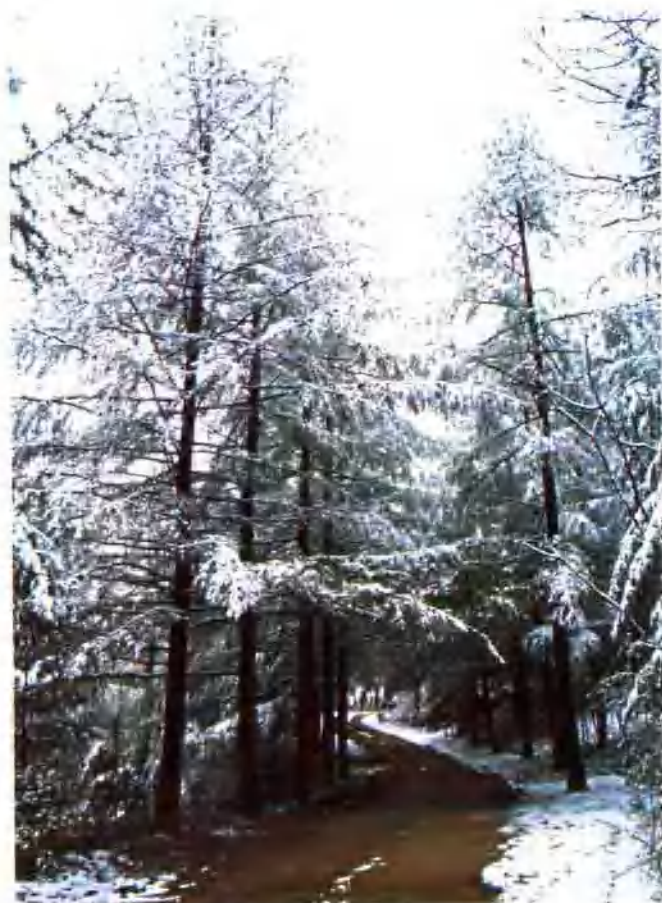
▲ 高君日本落叶松基地