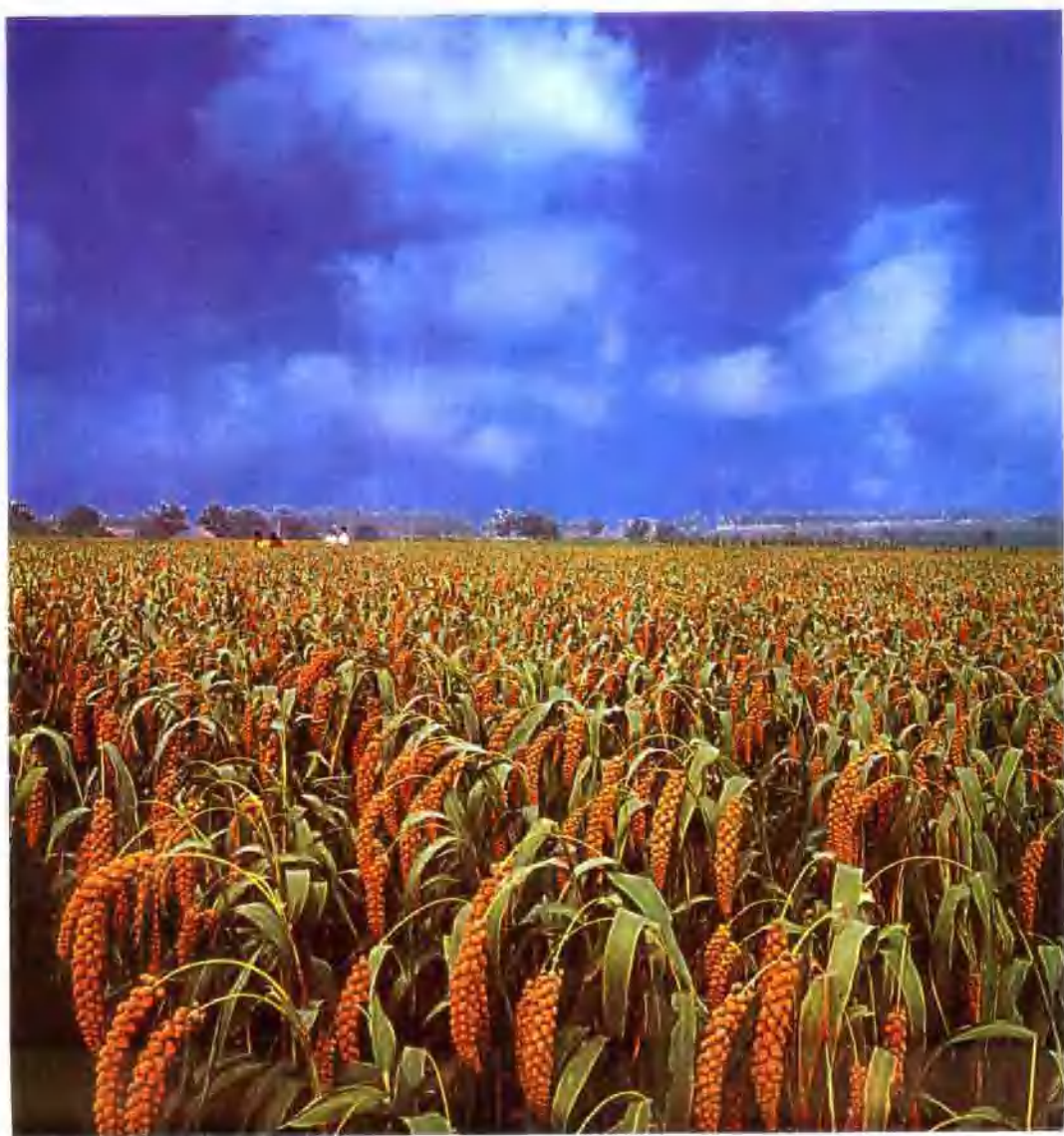
▲ 伊川县吕店乡谷子高产开发