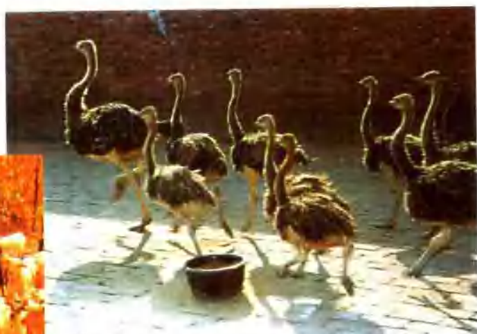
▲ 新安县五美鸵鸟养殖场