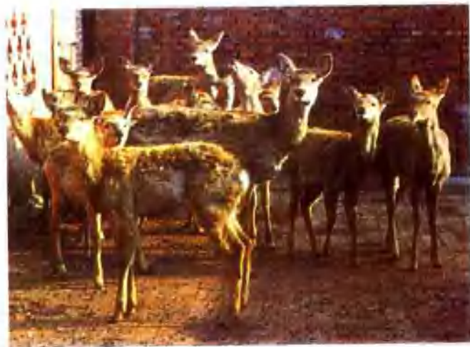
▲ 偃师日月山鹿养殖场