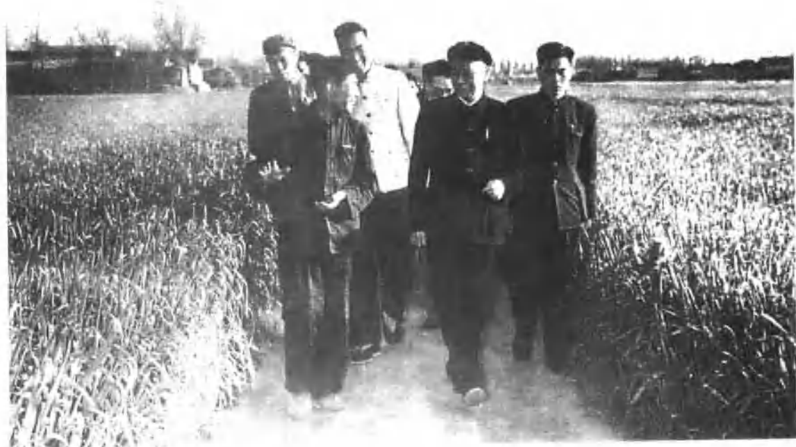
▲ 1960年4月20日，国家主席刘少奇视察偃师县东寺庄机井灌区麦田