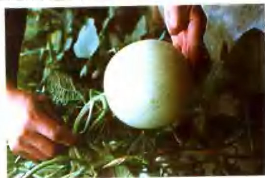
▲ 市农技站从日本引进的洋香瓜(玉露)