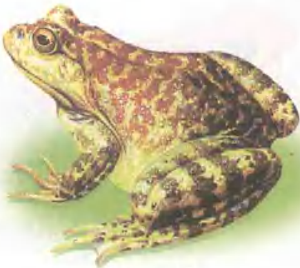
niú wā 牛 蛙

身体肥大的牛蛙，因鸣声宏亮，远听好似牛叫而得名。它后肢很长，趾间有蹼，体色能随环境而改变。牛蛙原产于北美洲，生活在池沼或水田间，以昆虫和小鱼为食。它肉细味鲜，很多人饲养它，以供食用。