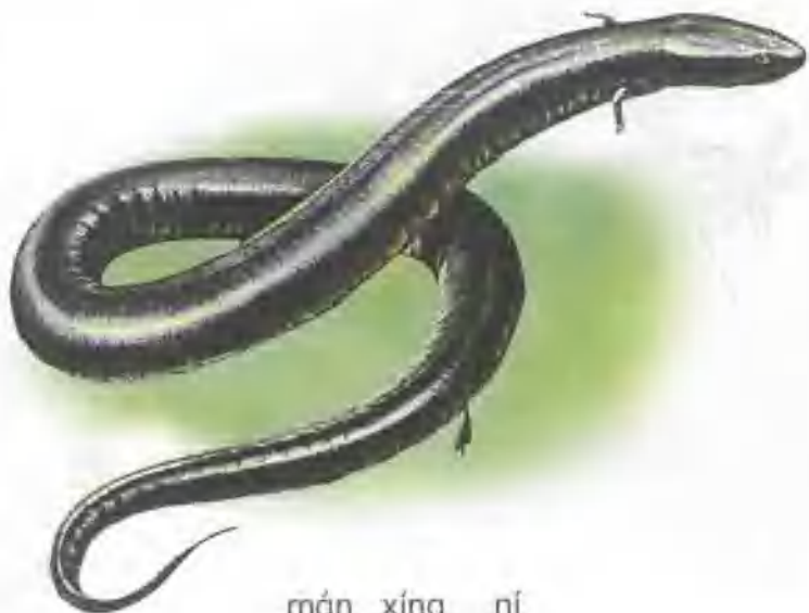
màn xíng ní 鳗型鲵

鳗型鲵的身体好像鳗鱼一样细长，四肢已经退化得非常短小了。它栖息在水中，白天隐藏在水草间或洞穴里，晚上出来觅食螅虾和小鱼。下雨时，鳗型鲵会爬到陆地上，隐避在草丛中觅食蜗牛。