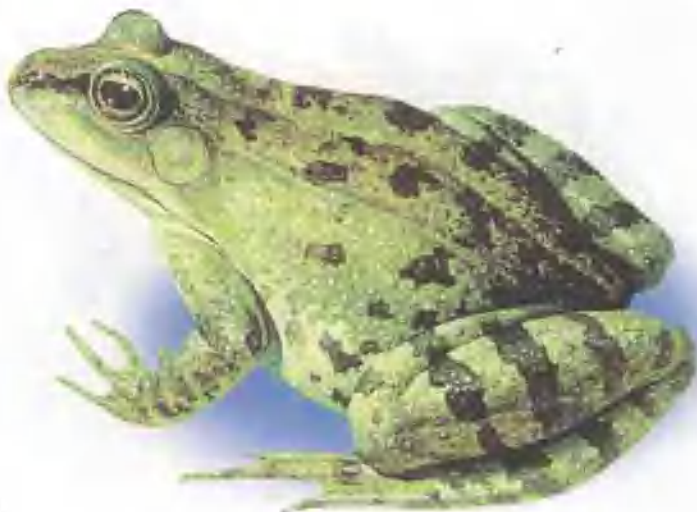
tián jī 田 鸡

田鸡是蛙类中较常见的一种。它的头宽扁，呈三角形，圆圆的眼睛向外突出。田鸡常栖息于池塘、水沟或河边的草丛中，善于用宽大的嘴巴和尖端分叉的长舌捕食田间害虫，是我们人类的好朋友。