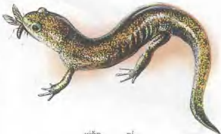
xiǎo nǐ 小 鲵

小鲵是现存有尾动物中最原始的一种。它们大多分布在东亚。幼体时在池中或溪流内成长，成体后便移至陆地上的森林中，在潮湿的落叶堆里或石头下生活。小鲵用肺和皮肤呼吸，主要吃白蚁、蜘蛛及昆虫。