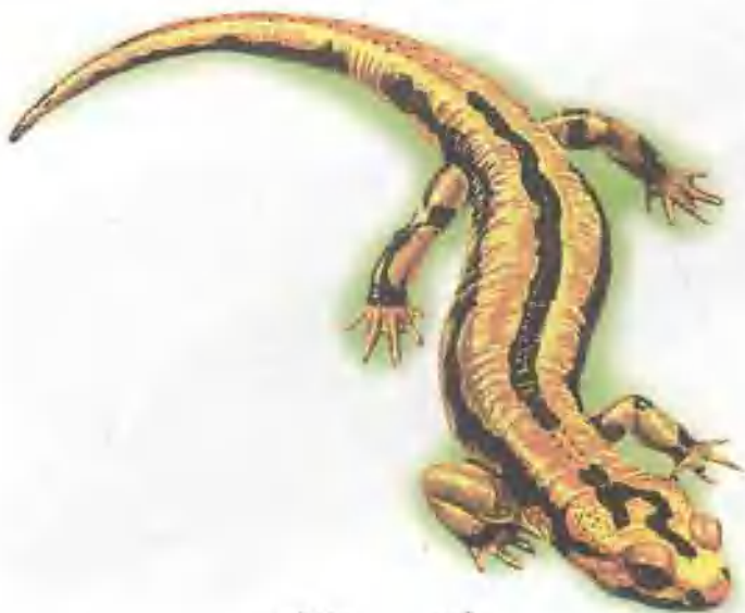
zhēn yuán 真 螈

耳腺分泌毒液的真螈，分布在欧洲大陆。它和其他蝶螈不同，成体后不会游泳，所以除幼体时期外，都生活在潮湿的丛林中。它喜欢在晚上觅食蚯蚓、潮虫等昆虫，但在雨后的白天也常出来活动。