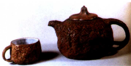
4 仿供春树瘿壶并配杯