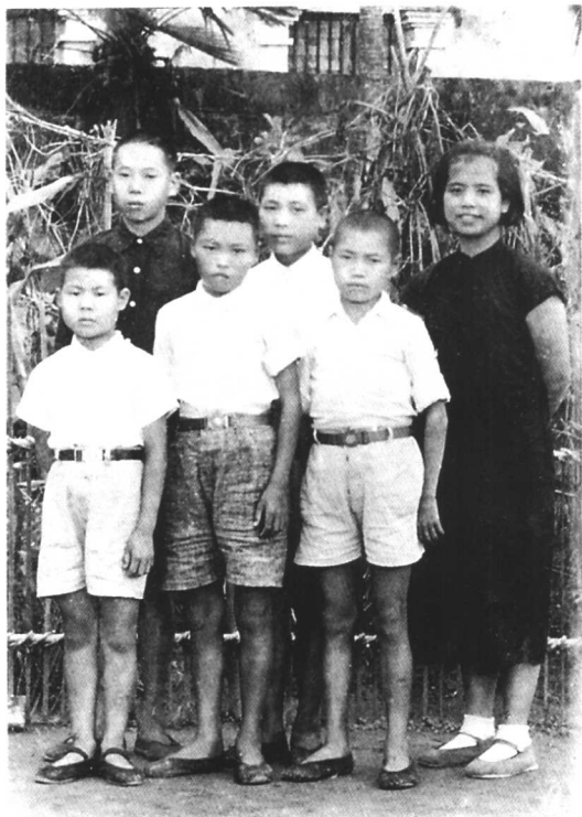
1945年，在瑞安 执教，与学生分别时 留影。