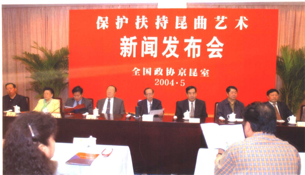
“保护扶持昆曲艺术”新闻发布会 2004年5月12日由王选在全国政协会议中心主持。