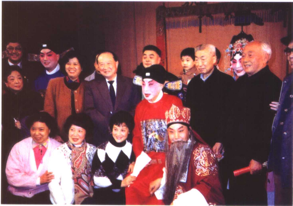
俞振飞先生从艺七十周年庆贺演出与上海市领导（右起胡立教、陈国栋、汪道涵、陈至立）合影。