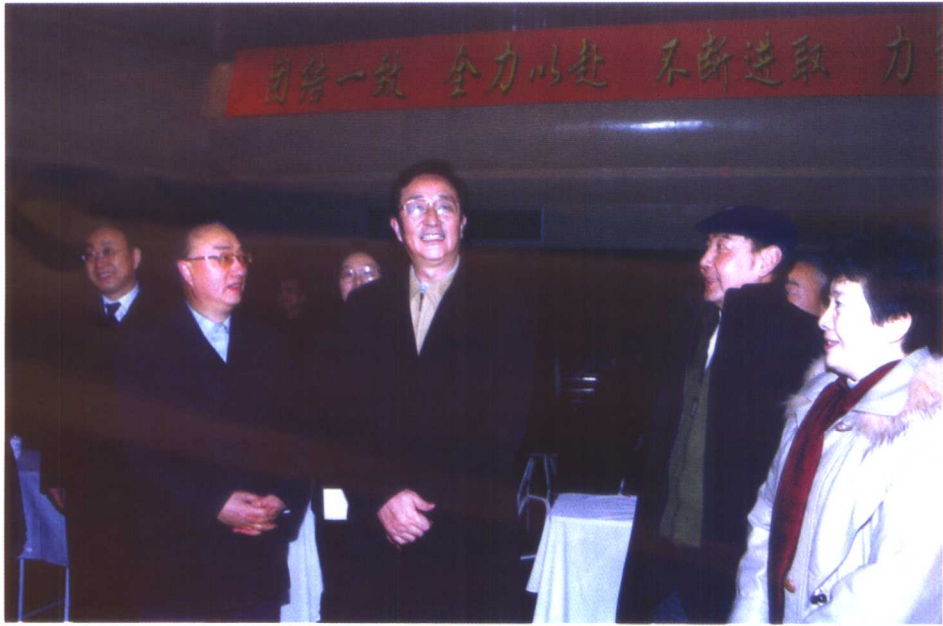
陈良宇同志视察上海昆剧团。