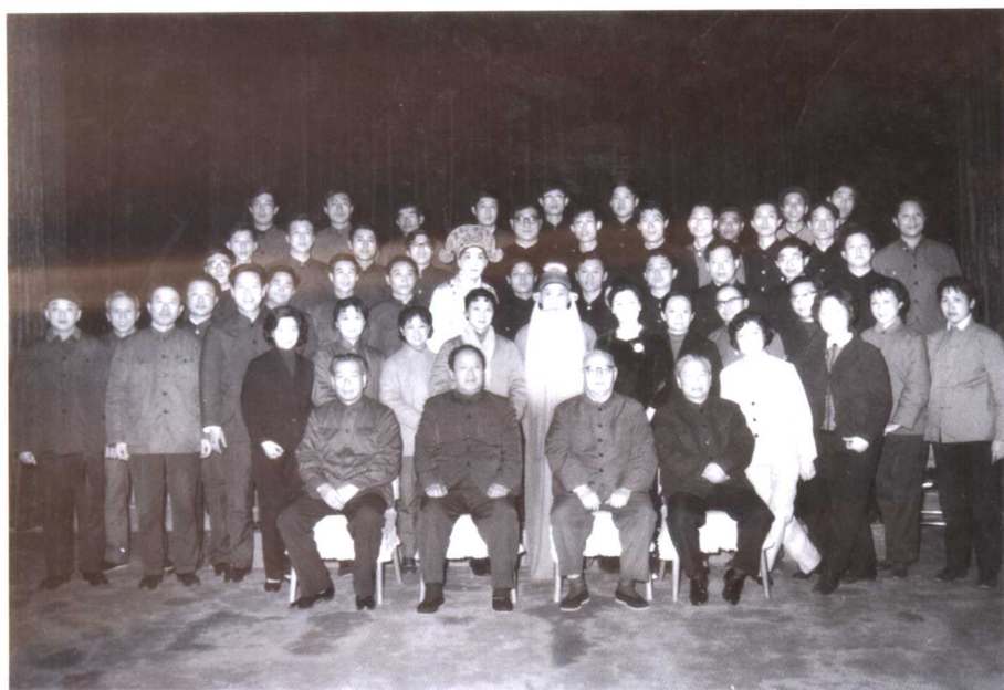
叶剑英和王一平、严佑民、彭冲等领导同志与上海昆剧团演职人员合影。