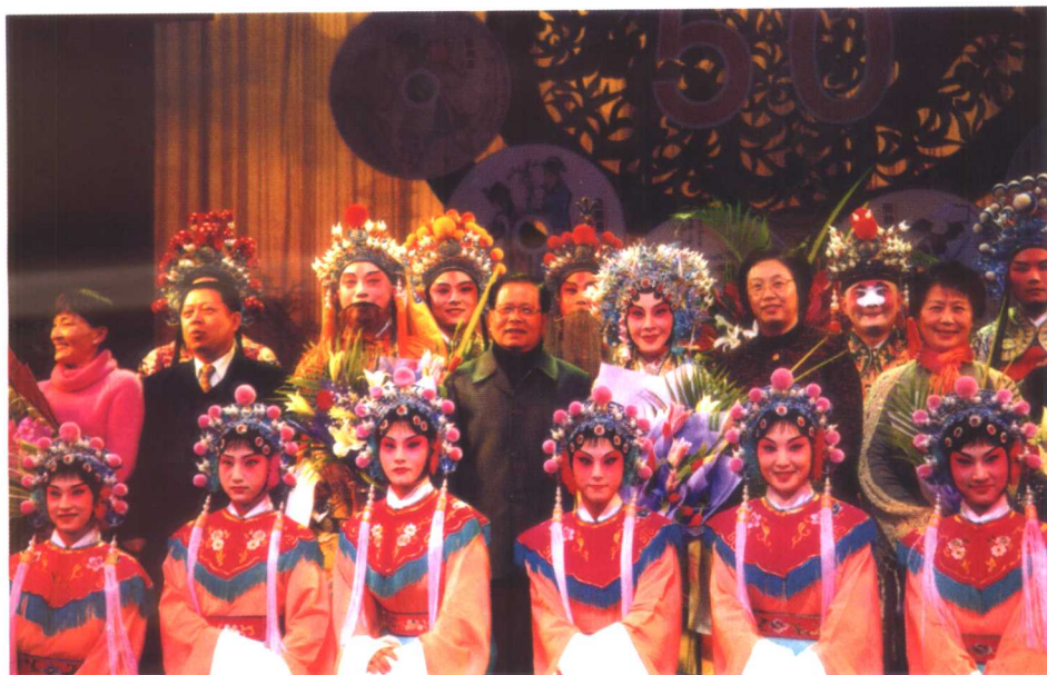
上海市领导龚学平、殷一璀、王仲伟同志与《长生殿》演出人员合影。