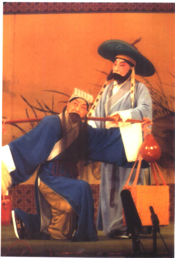
昆剧泰斗俞振飞先生与“传字辈”郑传鉴老师合演《千忠戮·惨睹》。