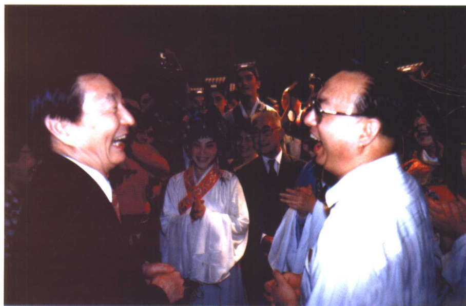
朱镕基同志接见《司马相如》演职人员。